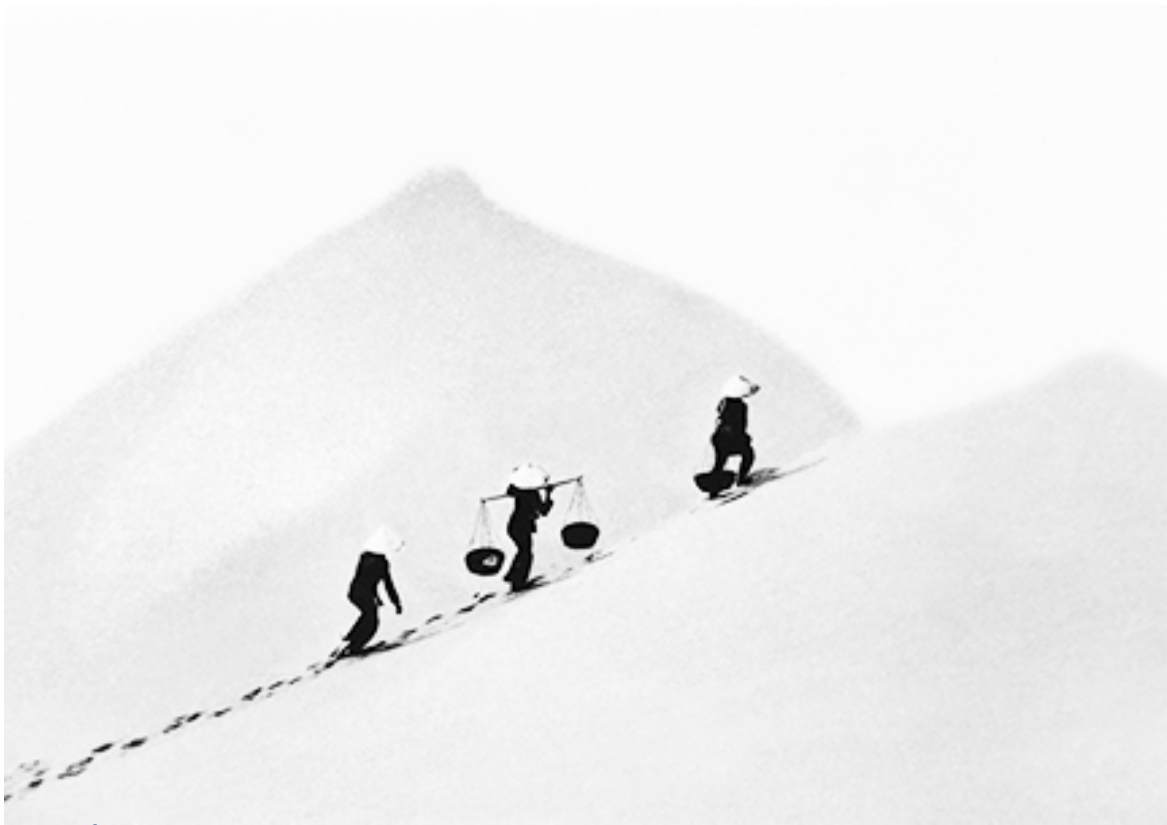
Lên Đồi (Lê Văn Khoa)

Có những bức ảnh mình nói rằng nó có giá trị rất cao, ví dụ những vụ giết người bắt được quả tang qua hình chụp, đưa ra tòa làm bằng chứng, thì lời nói biện minh không được. Nhưng mà thời đại này lại khác, chụp hình xong về thay đổi, tráo này kia bằng kỹ thuật photoshop, thì liệu có còn chân lý đó nữa hay không?.