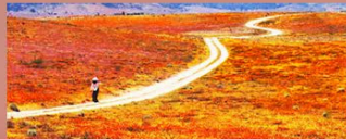
"Đường Về Còn Xa" Lê Văn Khoa

Mở cửa mỗi ngày từ 11 giờ sáng đến 7 giờ chiều từ ngày 18 đến ngày 26-2-2017