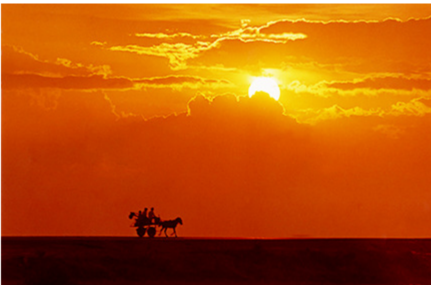
Chiều Tà (Lê Văn Khoa)

Làm sao mình thấy được những hình ảnh trên các thân cây do những vân cây tạo ra và chụp lại, có người đã hỏi tôi như vậy? Nhiều lúc tôi chỉ cho họ nhìn trên thân cây, tôi vẽ tay theo hình dáng, họ vẫn không nhận ra, bởi vì họ không có ý nhìn cái đó, không có sự tưởng tượng để nhìn ra hình ảnh đó. Có người thì nói chắc phải có tâm linh nào đó, mới nhìn ra những hình ảnh tạo ra từ vân cây trên gốc cây, tôi thì không tin như vậy. Tập nhìn quen, và mình sẽ thấy, hãy liên tưởng đến những gì mình đã thấy, đã biết thì mới liên kết được với nhau.