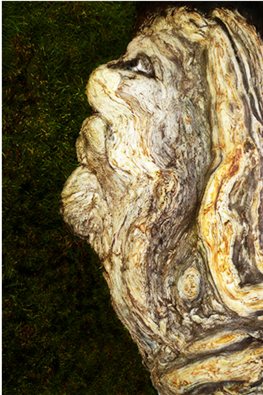
Ông Già Ở Laguna (Lê Văn Khoa)

“Khi chụp ảnh xong, giai đoạn về làm ra ảnh cũng tùy. Hồi xưa, làm phim giấy thường và chỉ có trắng đen phần lớn. Tới năm 1972- 73-74 mới bắt đầu có hình màu chút đỉnh, thường phải gửi đi qua HongKong hay nước khác để làm, sau đó thì tại Sài Gòn có một vài chỗ làm ảnh nhưng chưa cao. Lúc bấy giờ, tôi chú trọng nhiều vào ảnh đen trắng, nó khó ở chỗ chỉ có đen trắng, nhưng giữa đen và trắng có cả ngàn đợt đen, trắng đậm, lợt khác nhau, mình phải dùng nó như thế nào, diễn tả tâm trạng như thế nào. Chứ không phải hình nào ra cũng giống nhau hết.