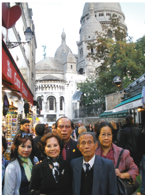
^ Bên Nhà Thờ Sacré Coeur.