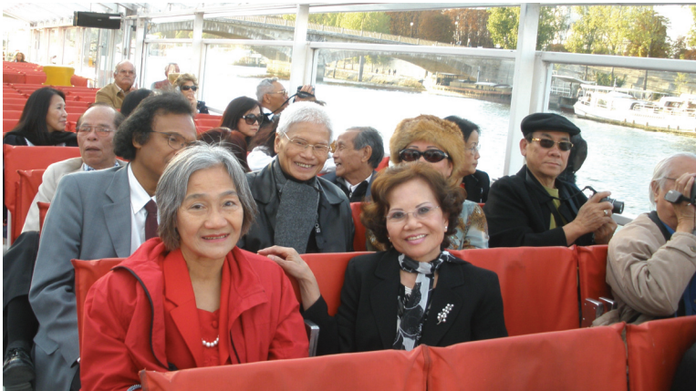
Bateau Mouche sur La Seine, 10-02-2009