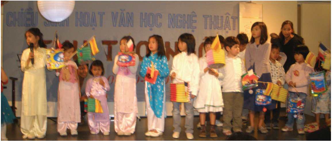
Các em thiếu nhi rước đèn Trung Thu.