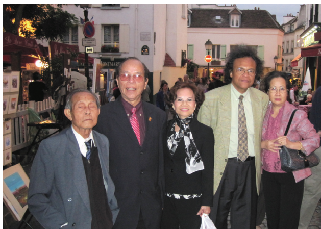
<Trong khu nghệ sĩ, hội họa, Montmartre.