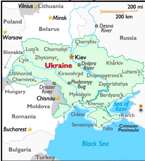
Bản đồ sơ lược của Cộng Hòa Ukraine

gồm: 78 % người gốc Ukraine, 18 % người Nga, 4% còn lại là dân ở các quốc gia lân cận. Khoảng 3 triệu người sinh sống ở Kyiv, Thủ Đô của Ukraine. Một số thành phố lớn khác như: Kharkiv, Odesa, Dnipropetrovsk, Lviv, Donetsk, Zaporizhzhya ... Các quốc gia cạnh biên giới gồm có: Belarus, Nga, Ba Lan, Slovakia, Hung Gia Lợi, Moldova, và Romania. Phía Nam của Ukraine là Hắc Hải (Black Sea), phía bên kia là Thổ Nhĩ Kỳ. Dnipro là con sông lớn và quan trọng nhất của Ukraine, chạy từ Bắc xuống Nam. Đất đai của Ukraine màu mỡ - phần lớn đất đen - rất tốt cho nông nghiệp. Từ khi độc lập đến bây giờ, ngôn ngữ riêng, Chính Thống Giáo (Orthodox) và văn hóa của Ukraine đang được phục hồi. Quốc Kỳ của Cộng Hòa Ukraine có hai màu, cân bằng về kích thước: phía trên màu xanh dương (tượng trưng cho bầu trời và sông nước) và phía dưới màu vàng (tượng trưng cho đồng lúa mì và hoa hướng dương - sunflowers).