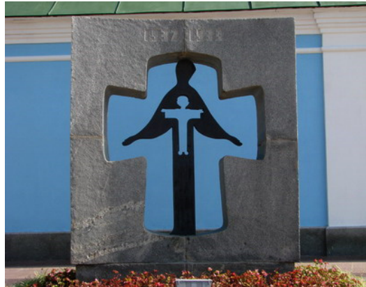
Đài Tưởng Niệm Nạn Nhân Holodomor ở Kyiv, Ukraine

Trong một Lễ Tưởng Niệm Nạn Nhân của Holodomor (theo tiếng Ukraine, “holod” là “đói, bị bỏ đói, nạn đói; và “moryty” là giết, tiêu diệt”), Tổng Thống Viktor Yushchenko của Cộng Hòa Ukraine tuyên bố như sau: ”Tôi lên tiếng với tất cả mọi người để thay mặt một quốc gia đã mất khoảng 10 triệu người, kết quả của cuộc diệt chủng Holodomor ... Chúng tôi nhấn mạnh cho toàn thế giới để hiểu sự thật về những tội ác chống lại nhân loại. Chỉ có cách đó chúng ta mới chắc chắn được những kẻ gây tội ác sẽ không còn bạo dạn vì sự hờ hững của mọi người”.