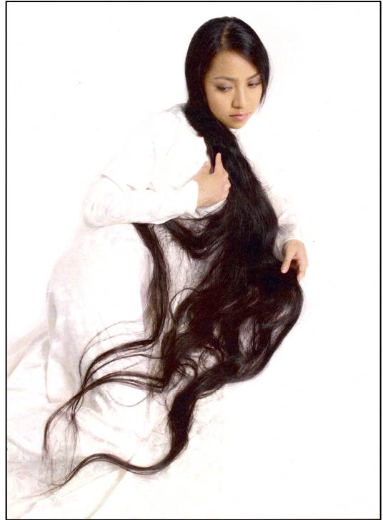
Suối Tóc 3 - Thái Đắc Nhã

Sự thành công đầu tiên của tác giả là ở điểm này. Cũng trong ý hướng đối chiếu đó, tác giả cho người mẫu ngồi dựa nghiêng, mái tóc kéo dài theo thân người. Tóc từ đỉnh đầu xuống đến chân. Phần thấy được của người là mặt và hai tay, dĩ nhiên quá ngắn sánh với chiều cao của toàn người. Ta thấy quả nhiên tóc thật dài.