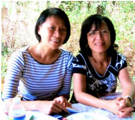
Ý Anh, Ngọc Trinh