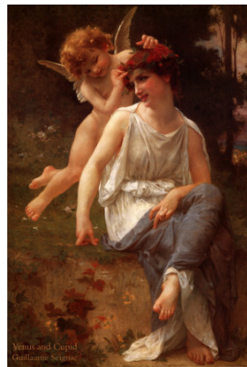
Venus và Cupid

Cũng nhân dịp lễ Tình Yêu ngày 14 tháng Hai, tác giả của những hàng chữ này muốn bàn về chuyện thần Cupid và chuyện tình yêu của chính vị thần này với Psyche. Phần đầu tóm lược câu chuyện thần thoại Roman - Greek và sau đó là phần cảm nghĩ của người viết.