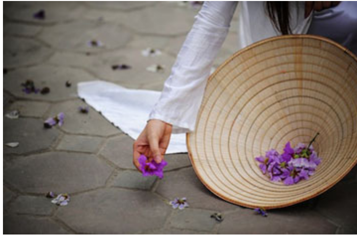
Những vĩa hè cũng trải màu của bằng lăng