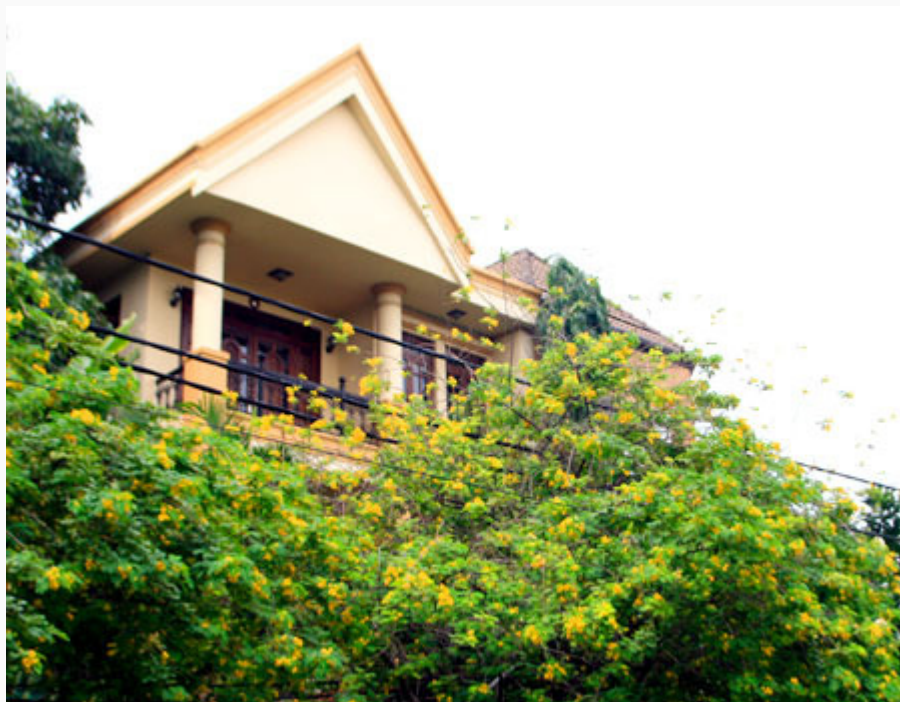
Tô điểm thêm cho cuộc sống.