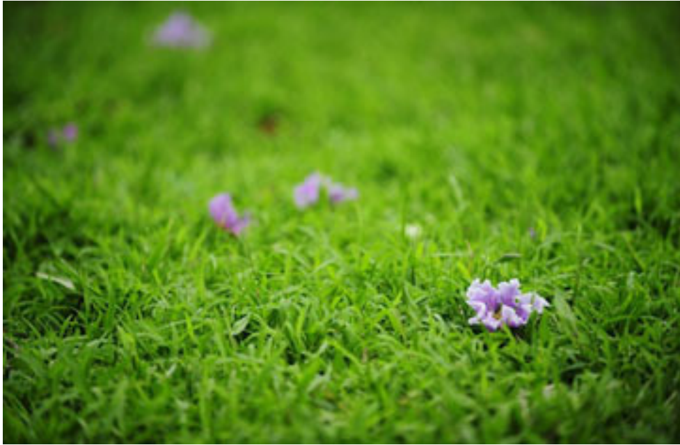
Roi nhẹ xuống thảm cỏ xanh