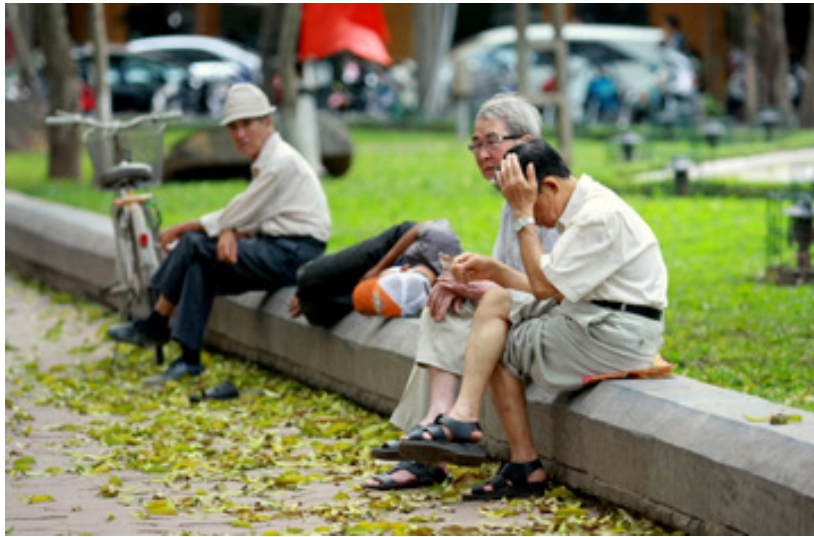
Cảm giác thật thanh bình