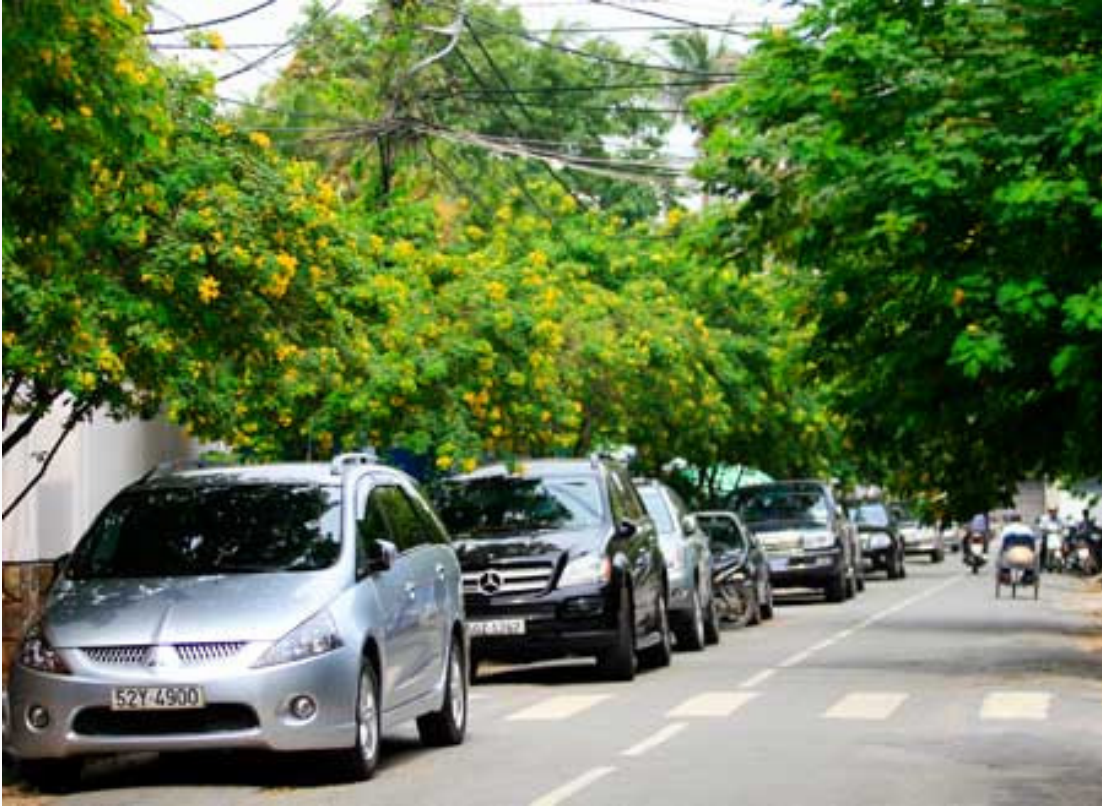
Hoa điệp vàng ươm cả một đoạn đường Lê Ngô Cát, quận 3.

Sắc hoa điệp dưới nắng tháng 5 nhuộm vàng nhiều tuyến đường Sài Gòn, làm đắm say lòng người. Người dân thành phố tranh thủ thư giãn dưới những tán cây đầy hoa, chỉ nở rộ chừng 1 tháng trong năm.