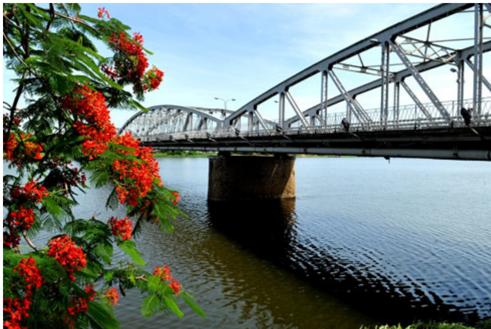
Những nhành phượng đang nở đỏ rực bên cầu Trường Tiền.

Xứ Huế mùa phượng nở. Bên cầu Trường Tiền, những nhành hoa phượng đỏ rực, tô điểm thêm vẻ đẹp mùa hè của xứ Huế mộng mơ.