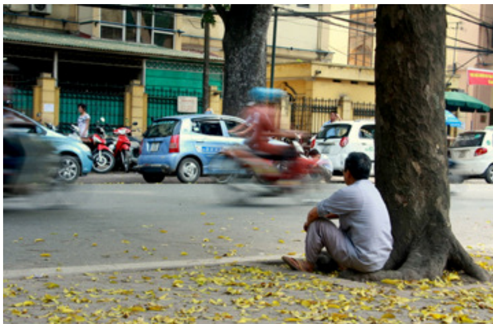
Trái ngược với sự tấp nập hối hả ngoài đường