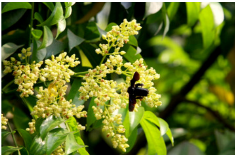
Những bông hoa sấu cũng bắt đầu nở