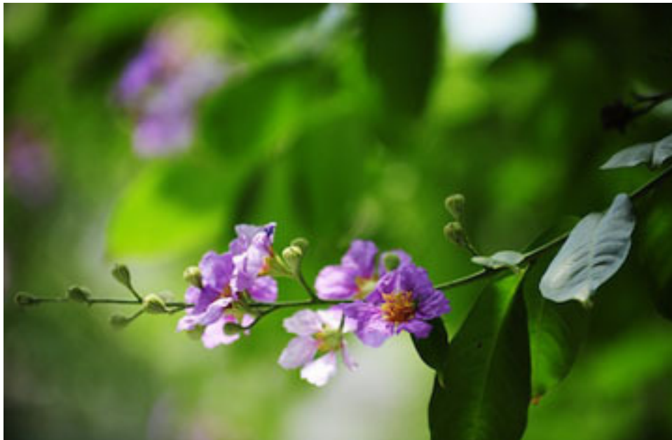
Những bông hoa đung đưa trong gió