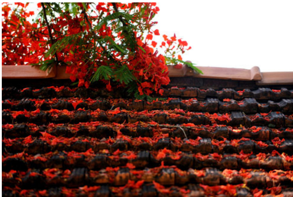
Phượng rụng đầy mái ngói, rung rinh trong nắng sớm, thu hút bạn trẻ tới nghỉ chân.