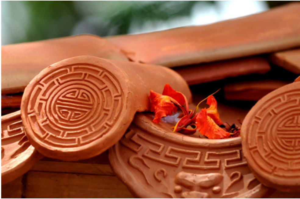
Rừng đầy mái ngói