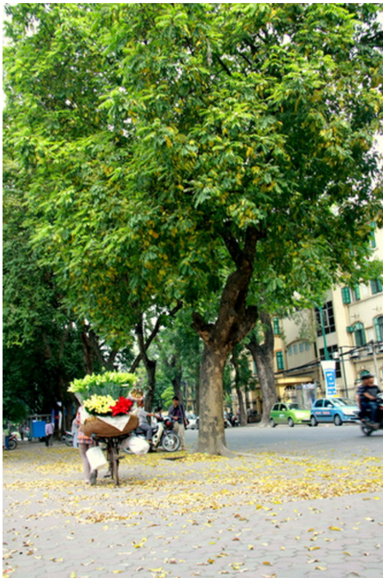
Khi cái nắng sớm của mùa Hạ vừa đến, là lúc những cây sấu già bắt đầu thay lá

Mùa lá bay nhanh lắm, chỉ dăm ba ngày thôi, khi người ta còn chưa kịp xao xuyến thì mùa lá đã bay đi để lại bao nuối tiếc.