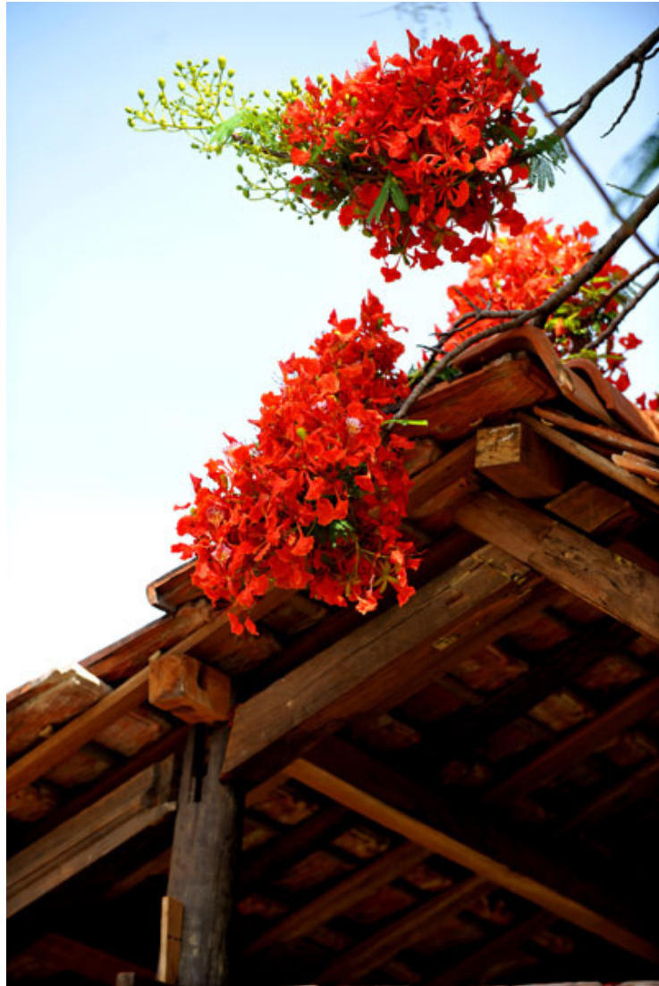
Từng chùm hoa rung rinh rủ mái nhà.