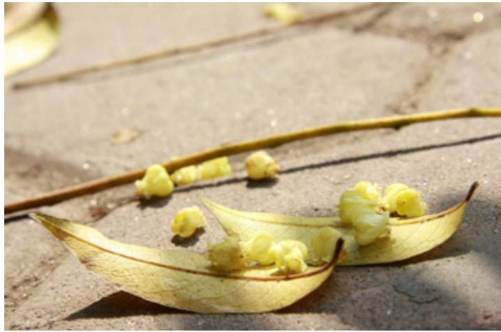
Hoa nhỏ li ti, rơi rớt bên cạnh những chiếc lá vàng