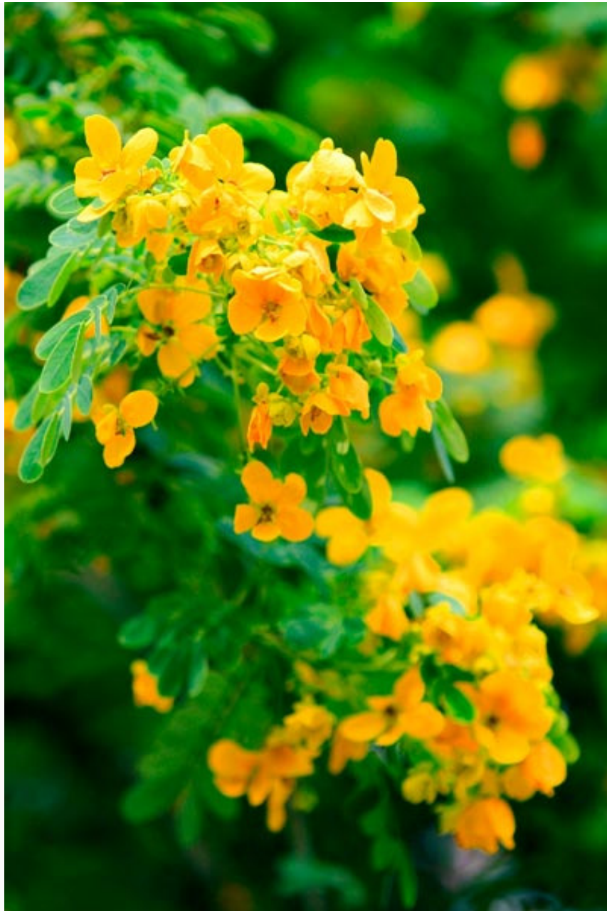
Vàng như nắng.