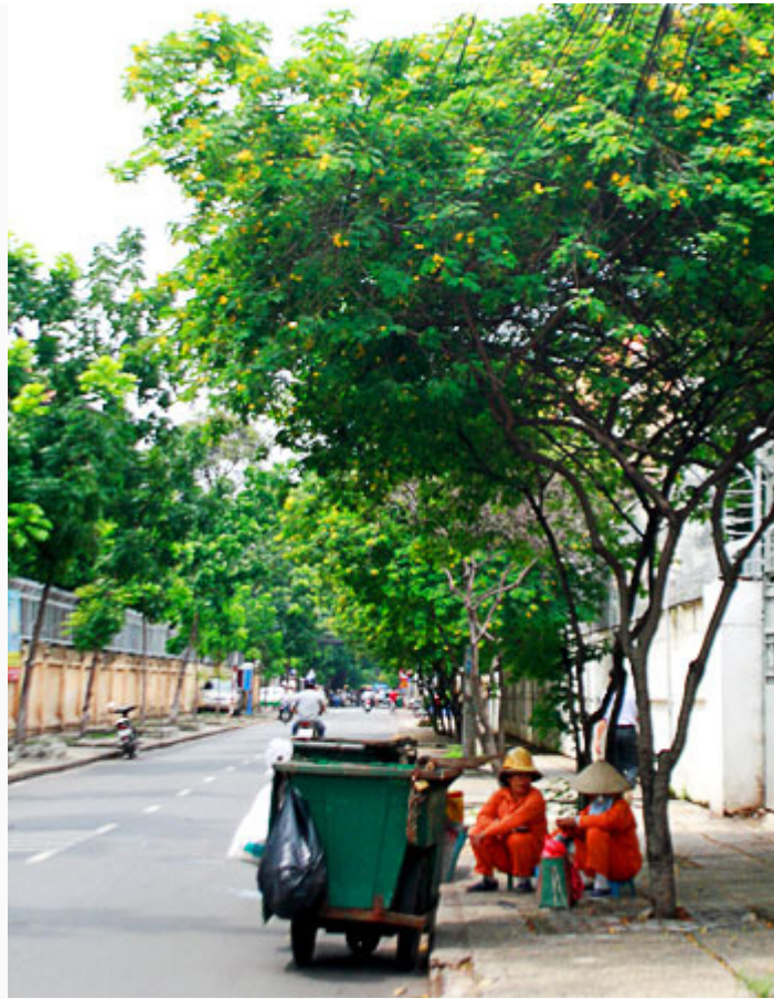
Che mát cho một ngày cực nhọc của các công nhân vệ sinh.