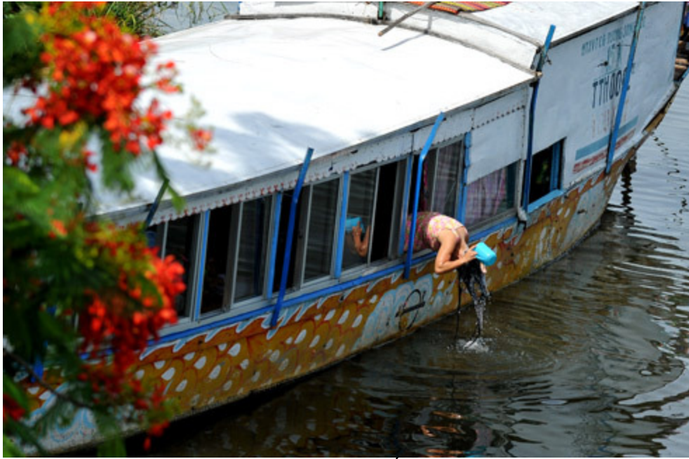
Làm bóng mát cho những người sống lênh đênh trên sông.