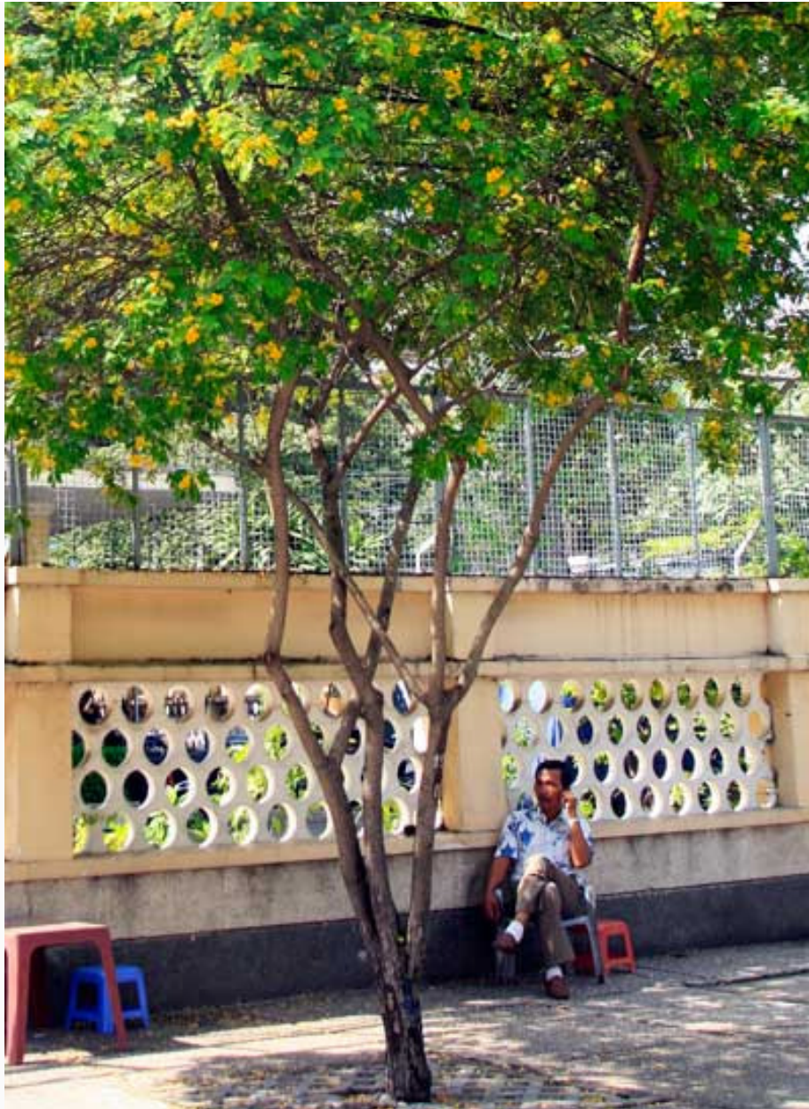
Gốc điệp trở thành góc riêng ban trưa của người Sài Gòn, vừa uống trà đá vừa lắng nghe tiếng ve ran.