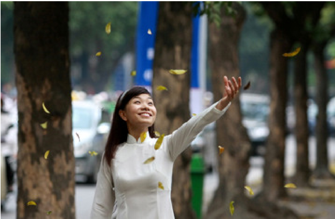
Một cơn gió nhẹ, lá xoay xoay trong gió làm say đắm lòng người