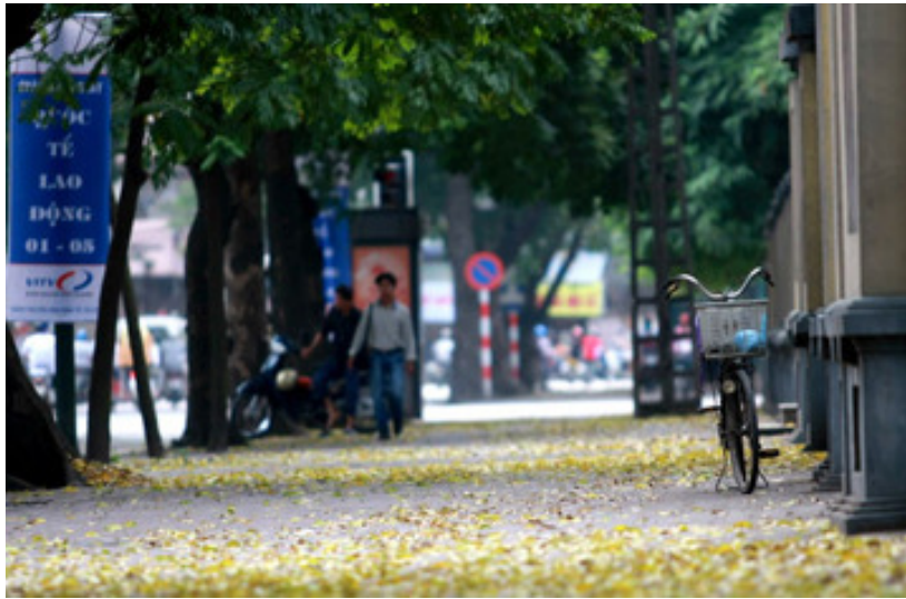
Lá đổ vàng như trải một lớp thảm trên các con phố