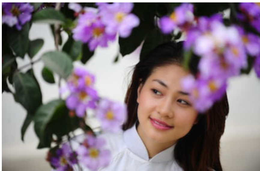
Cùng đôi mắt trong veo của cô nữ sinh...