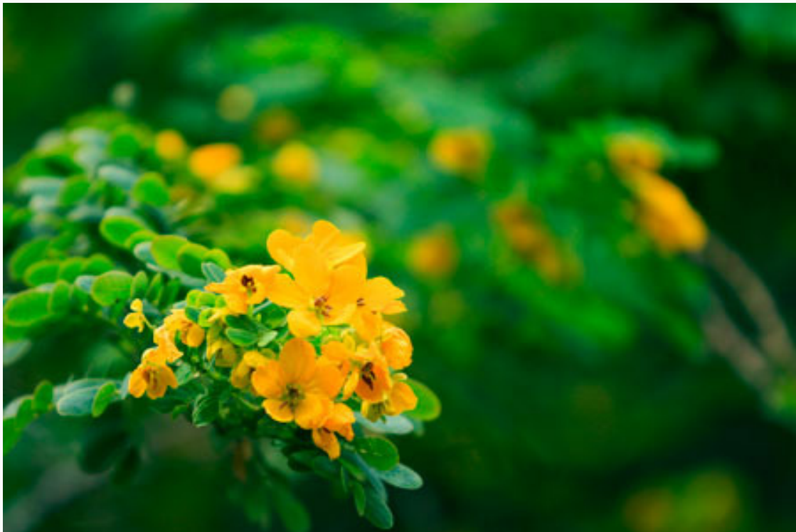
Với nét đẹp rất riêng, hoa điệp là cảm hứng sáng tác cho nhiều nhà thơ, nhạc sĩ: "Một chiều đi trên con đường này, hoa điệp vàng trải dưới chân tôi..."