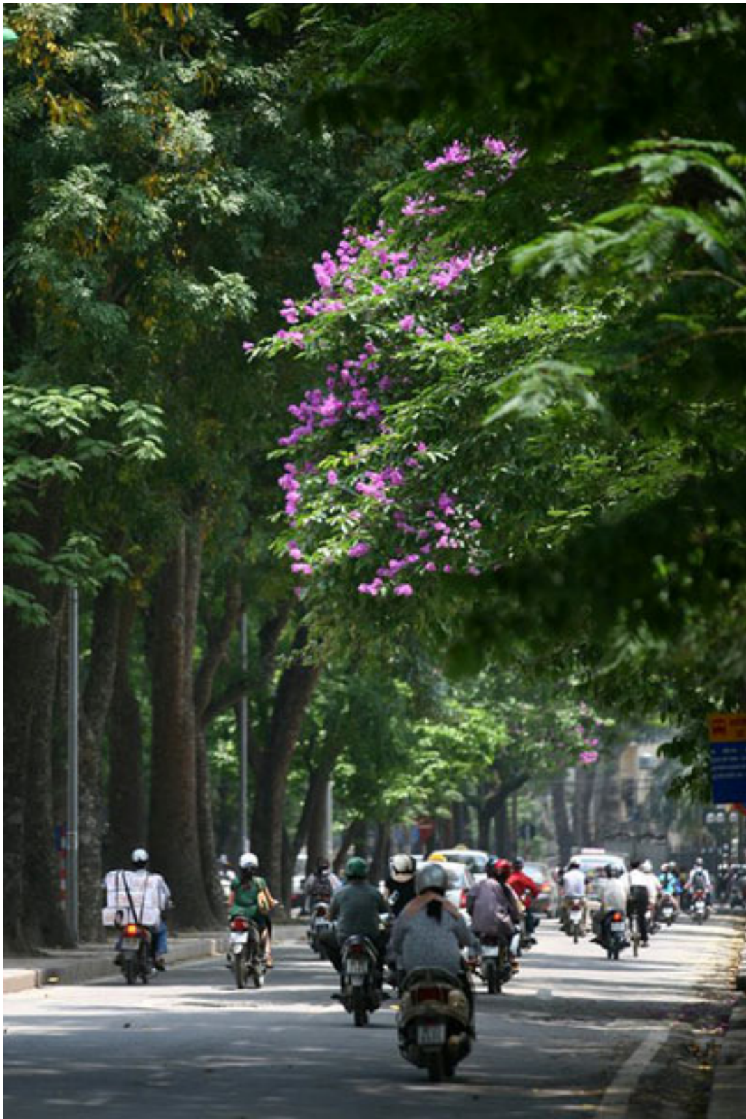
Tạo nên những con phố màu tím