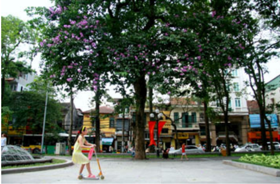
Tháng 5, những cây bằng lăng bắt đầu được phủ lên một màu tím