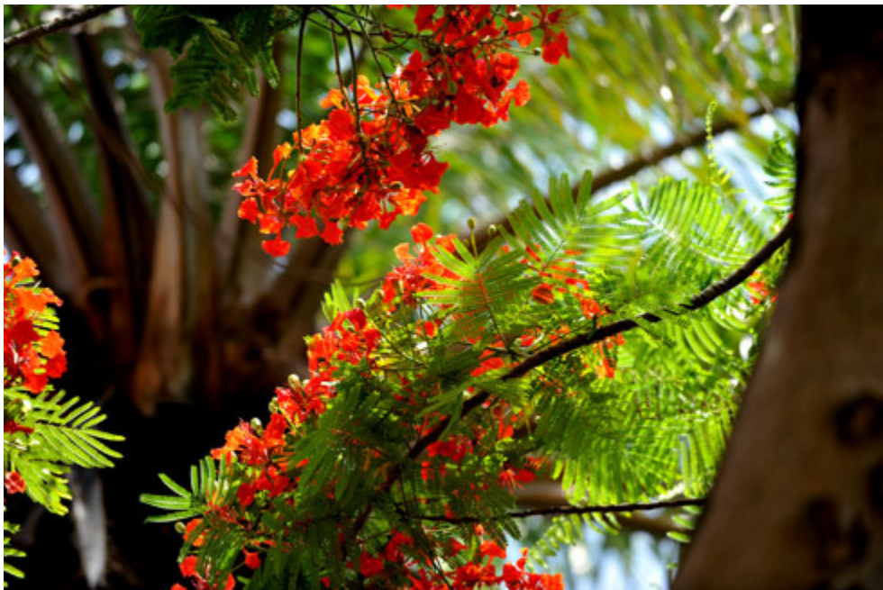
Tỏa nét đẹp trong nắng sớm.