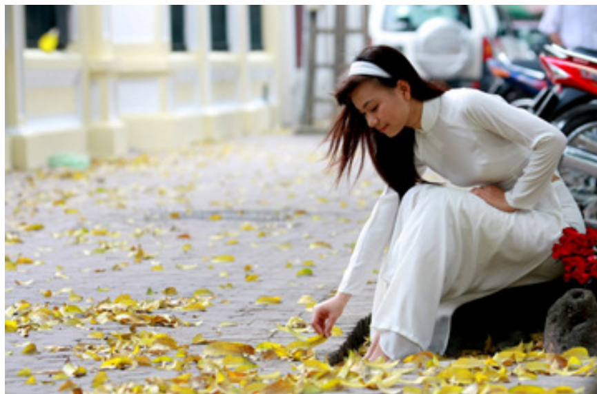
Lá trái vàng trên những vỉa hè