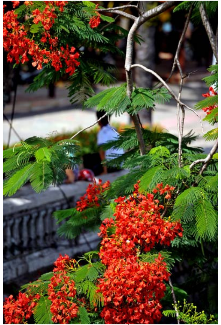
Tạo nên một vẻ đẹp riêng của mùa Hè bên dòng sông Hương êm đềm.