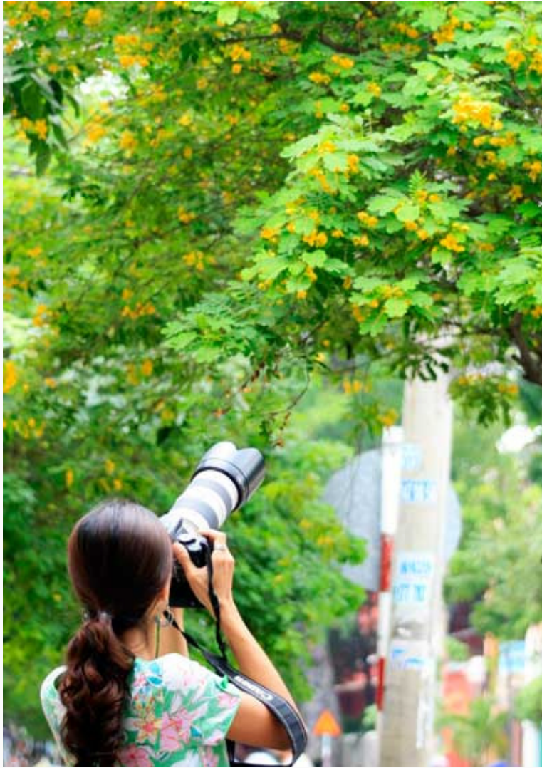
Lưu giữ sắc đẹp vàng.