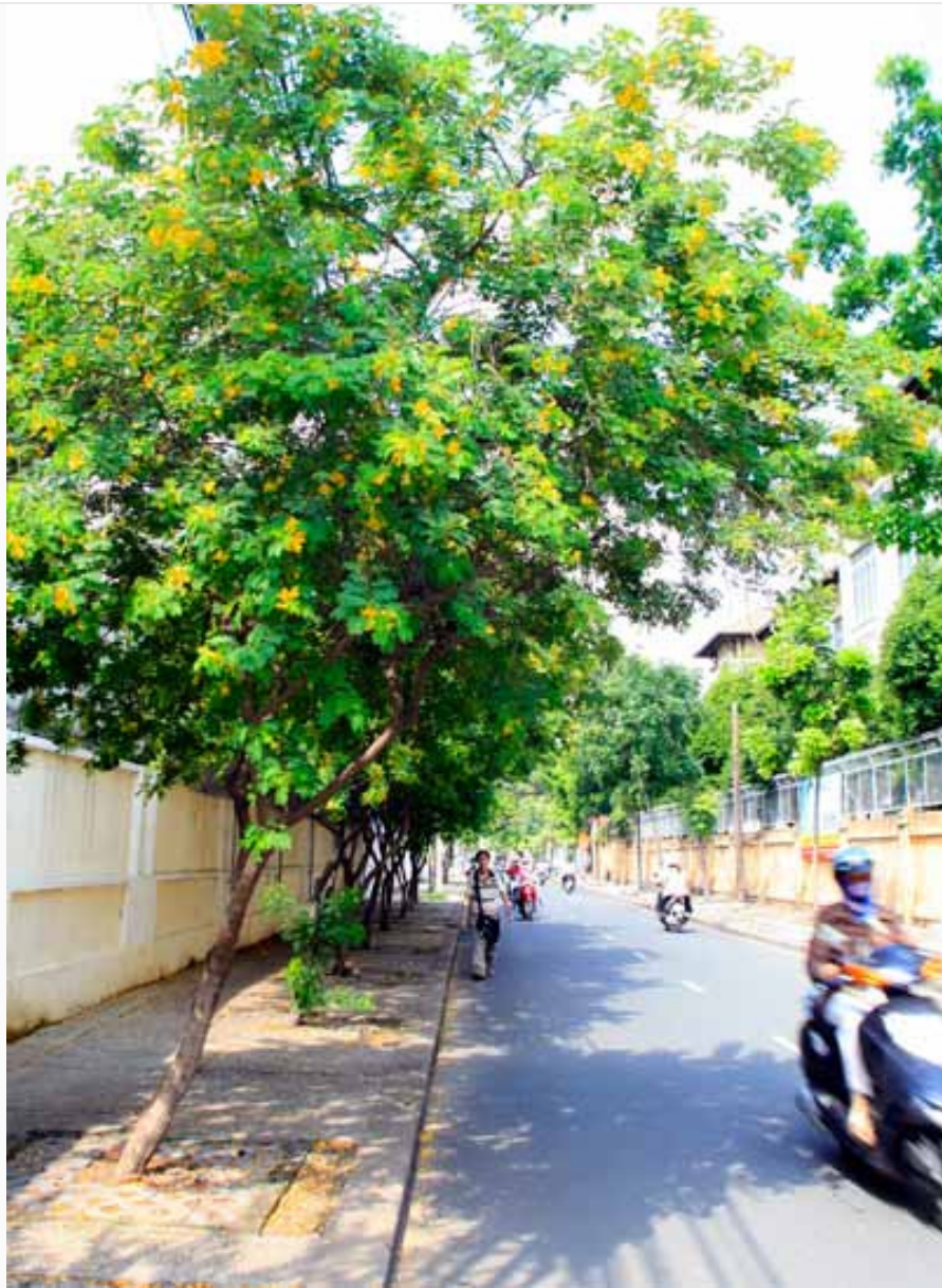
Phố Ngô Thời Nhiệm nên thơ với những tán hoa rực sắc.