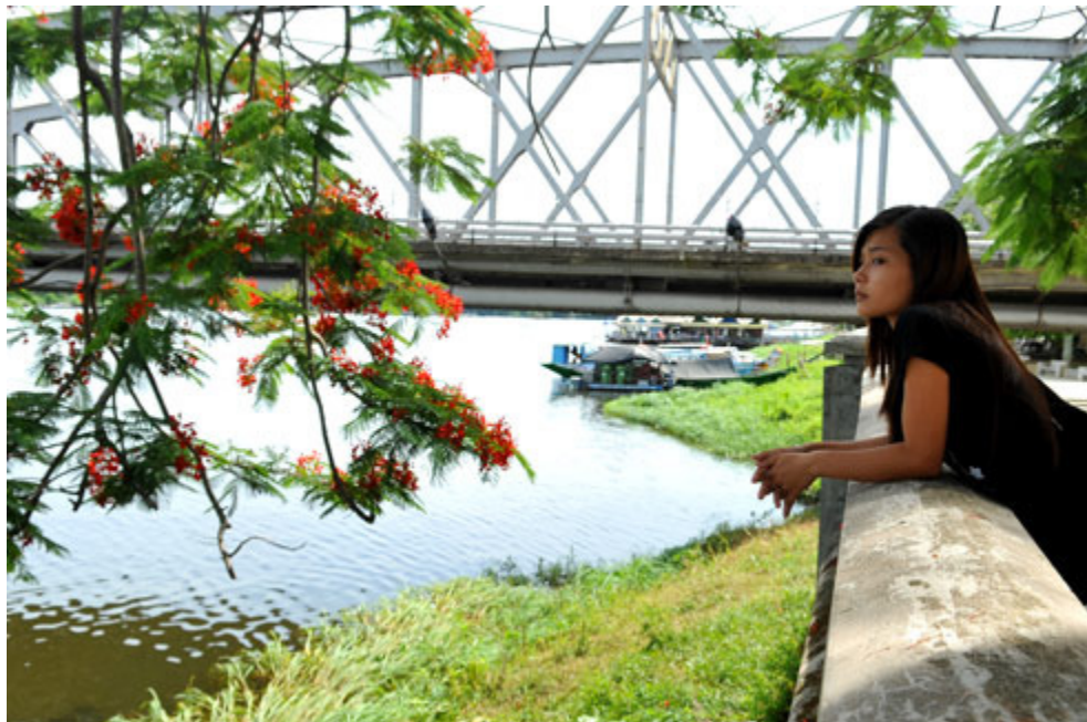
Thành nơi trú chân, nghỉ ngơi lý tưởng của nhiều bạn trẻ.