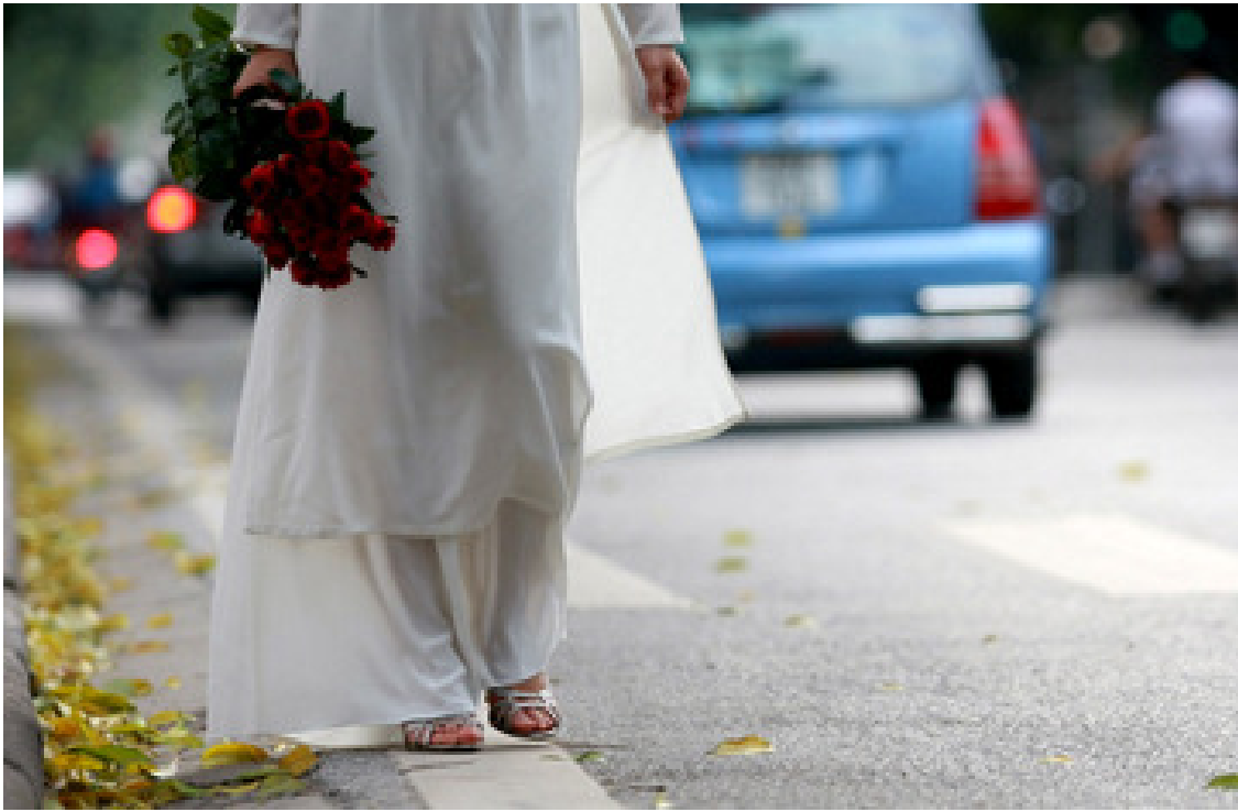
Hay cuốn theo bước chân nhẹ nhàng trên phố