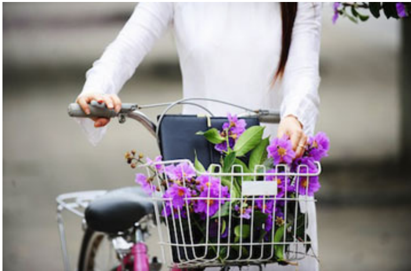
Bằng lăng cũng gắn với những kỷ niệm về thời áo trắng