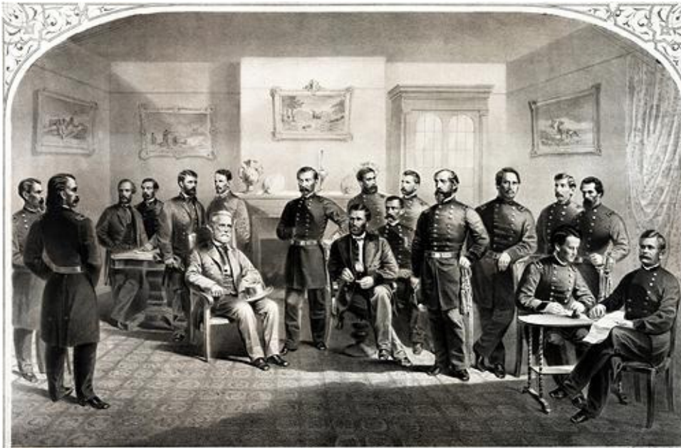
Hình ảnh nước Mỹ vĩ đại.

Theo bảng xếp hạng hàng năm của Viện Quốc Phát Triển Quản Trị (International Institute of Management Development viết tắt là IMD) tại Lausanne, Thụy Sĩ, Hoa Kỳ đứng đầu trong danh sách những nước có khả năng cạnh tranh cao nhất thế giới, tiếp theo là Thụy Sĩ, Hồng Kông, Thụy Điển, và Singapore. Đức đứng hạng 9. Trung Quốc và Nga lần lượt đứng hạng 21 và 42 trong số 60 quốc gia IMD nghiên cứu.