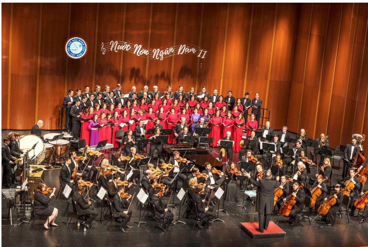
Ban Hợp Xướng Việt (Viet Choir) trong màn Hẹn Một Ngày Về

Ban hợp ca hát rất tốt, tạo được hào khí cho thánh giả. Cả hội trường đứng lên tán thưởng sau màn kết 🎵 “Hẹn Một Ngày Về” hát chung với toàn thể nghệ sĩ trên sân khấu.