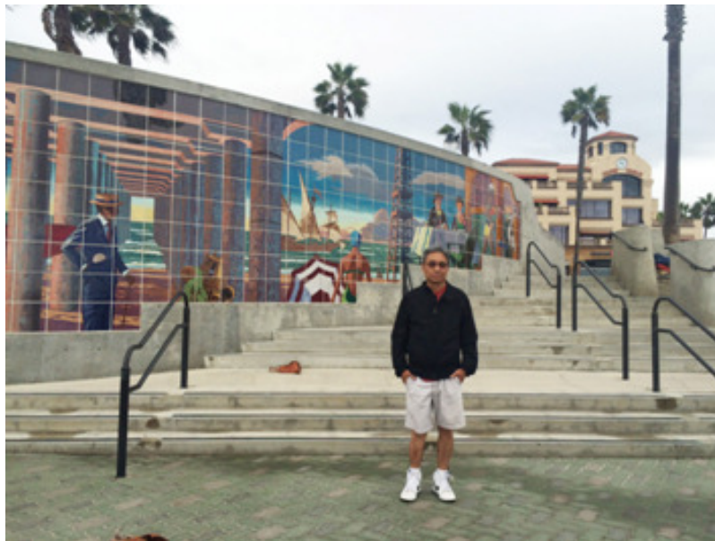
Huntington Beach Mural Oct 4, 2015