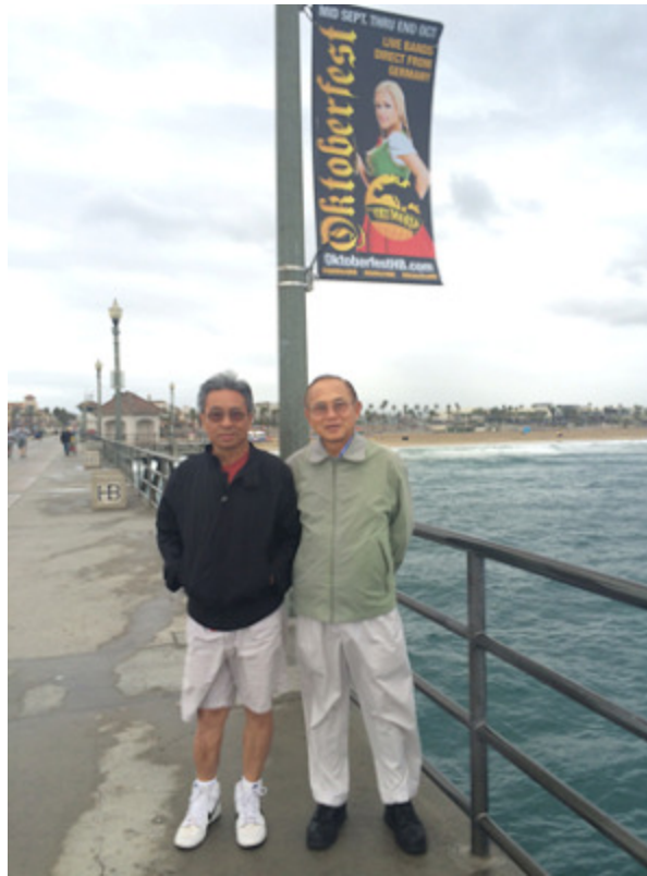
Huntington Beach Pier Oct 4, 2015