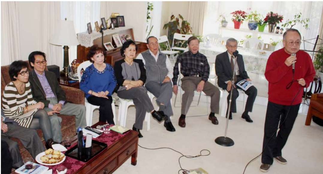
Nhà thơ Ngô Tăng Giao hát rất hay.