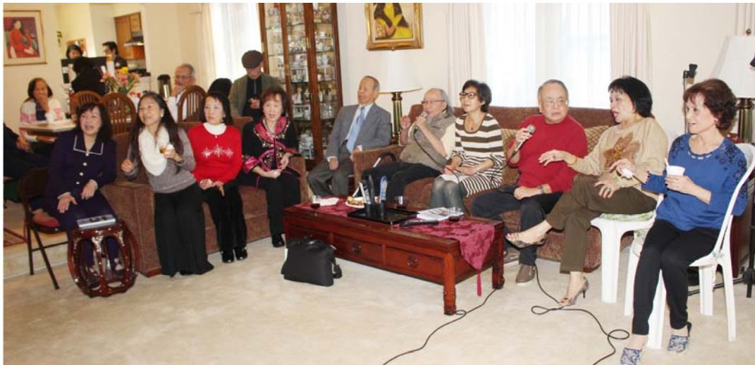
Đồng ca "Ly Rượu Mừng"