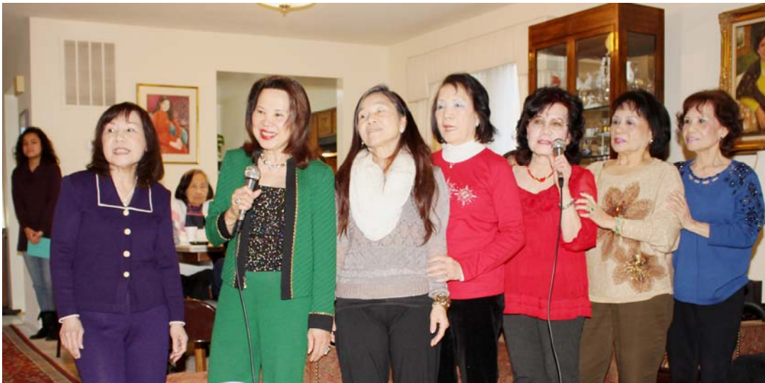
Đồng ca "Ngàn Thu Áo Tím"