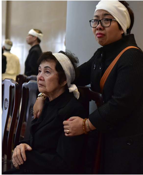
Vợ và cháu dâu của cố nhạc sĩ Hoàng Dương bù ngùi trước sự mất mát của gia đình trong những ngày đầu năm Đinh Dậu.