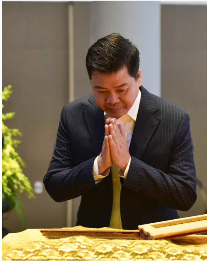
Ca sĩ Đăng Dương cũng kịp tới dự lễ tang vị nhạc sĩ tiền bối.