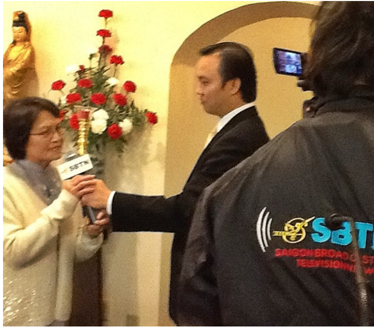
SBTN-Boston phỏng vấn TBTC