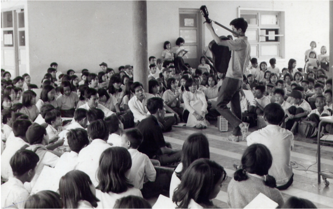
ẢNH 1: Học sinh KMTĐ hát theo Nguyễn Đức Quang, quãng 1969