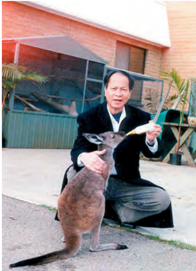
ẢNH 3: “Mẹ” Quang cho “con” kangaroo bú sữa, Melbourne, 7/2001

Vì chuyến lưu diễn 2001 quá thành công nên chỉ hai năm sau Anh lại được mời trở lại Úc Châu. Rất tiếc, khi Anh đến Sydney năm 2003, tôi không tham dự được vì phải đi xa. Tuy nhiên bà xã tôi có mặt tối hôm đó và đã mua hai CD Đường Việt Nam & Bên kia sông . Tôi nghe kể lần này Anh tập trung vào một số bản tình cảm nhẹ nhàng mà anh sáng tác sau này (một số lớn nằm trong CD Bên kia sông ). Theo tin của Ban Tổ chức, chuyến lưu diễn lần này đã đạt được con số khán giả kỷ lục, vượt hẳn những hành trình du ca khác của Anh. Ngoài ra, tôi cũng đặt mua một băng video buổi trình diễn của Anh tại Bankstown Town Hall, cũng qua Trường Thuất. Tôi xem tập nhạc Dưới ánh Mặt trời , ba CD và hai video là tài sản cá nhân quý báu nhất của tôi ngày nay!