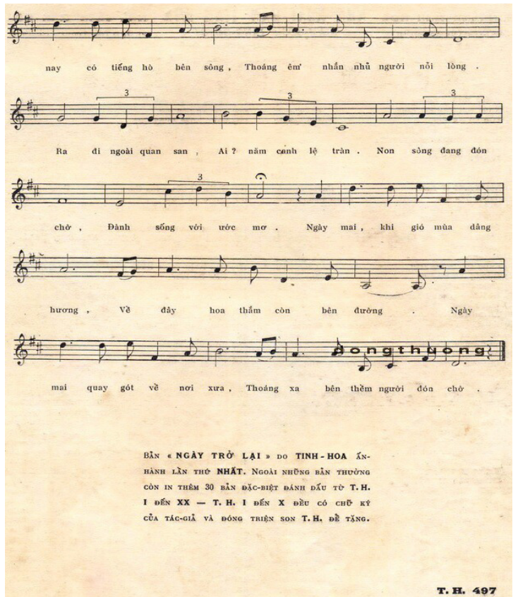
(Bản nhạc Ngày Trở Lại của Thanh Hiếu do NXB Tinh Hoa ấn hành do Đông Thương sưu tầm và gửi tặng Cỏ Thơm)