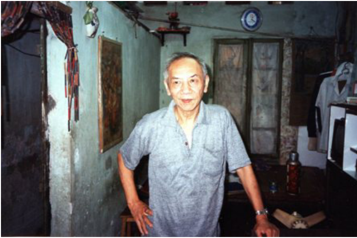
NS Hoàng Giác 1996