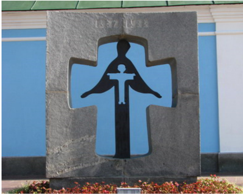
Đài Tưởng Niệm Nạn Nhân Holodomor ở Kyiv, Ukraine

Mấy trăm năm qua, người dân Ukraine cũng đã trải qua nhiều chinh chiến với các quốc gia lân cận như Ba Lan, Áo ... và trong Thế Chiến Thứ Hai, Ukraine, vì thuộc Nga Sô, là nơi xảy ra nhiều trận đánh ác liệt giữa Nga Sô và Đức Quốc Xã. Khoảng 8 triệu người đã chết và rất nhiều thành phố, đường xá, nông trại bị tàn phá. Đọc lịch sử của Ukraine, tôi không khỏi ngậm ngùi nghĩ đến lịch sử oai hùng nhưng không kém đau thương của Việt Nam với những chiến tranh chống lại quốc gia khổng lồ Trung Hoa ở phía Bắc, giành độc lập từ Thực Dân Pháp và cuộc chiến tranh vừa qua, khoảng 5 triệu người chết, gây nên bởi Hồ Chí Minh và những người Cộng Sản, tay sai của Cộng Sản Sô Viết. Tôi cũng không khỏi nghĩ đến Nạn Đói Năm Ất Dậu 1945, khoảng 2 triệu đồng bào ở miền Bắc đã chết vì chính sách bành trướng ở Đông Nam Á của quân phiệt Nhật!