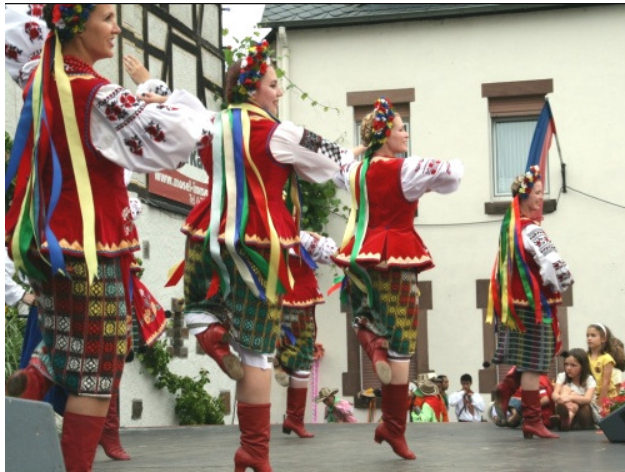
Quần áo cổ truyền của Ukraine