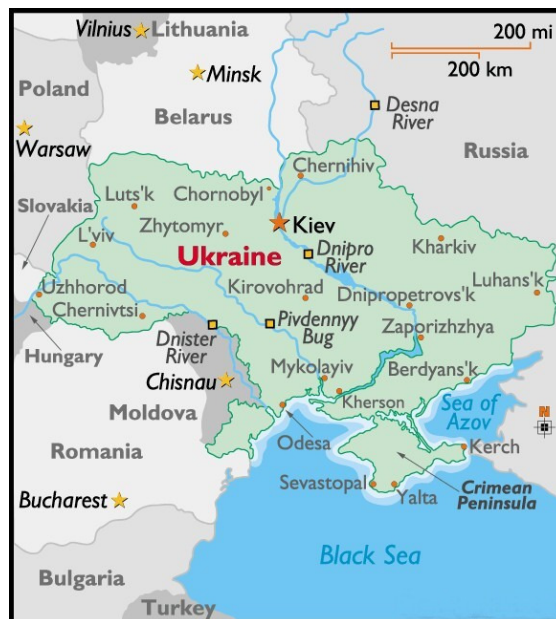
Bản đồ sơ lược của Cộng Hòa Ukraine

Tên chính thức của Ukraine là Cộng Hòa Ukraine (The Republic of Ukraine), một quốc gia rộng khoảng 600 ngàn km vuông (nhỏ hơn Tiểu Bang Texas một chút); với khoảng 46 triệu dân (theo thống kê năm 2010), đứng hàng thứ 5 ở Âu Châu, gồm: 78 % người gốc Ukraine, 18 % người Nga, 4% còn lại là dân ở các quốc gia lân cận. Khoảng 3 triệu người sinh sống ở Kyiv, Thủ Đô của Ukraine. Một số thành phố lớn khác như: Kharkiv, Odesa, Dnipropetrovsk, Lviv, Donetsk, Zaporizhzhya ... Các quốc gia cạnh biên giới gồm có: Belarus, Nga, Ba Lan, Slovakia, Hung Gia Lợi, Moldova, và Romania. Phía Nam của Ukraine là Hắc Hải (Black Sea), phía bên kia là Thổ Nhĩ Kỳ. Dnipro là con sông lớn và quan trọng nhất của Ukraine, chạy từ Bắc xuống Nam. Đất đai của Ukraine màu mỡ - phần lớn đất đen - rất tốt cho nông nghiệp. Từ khi độc lập đến bây giờ, ngôn ngữ riêng, Chính Thống Giáo (Orthodox) và văn hóa của Ukraine đang được phục hồi. Quốc Kỳ của Cộng Hòa Ukraine có hai màu, cân bằng về kích thước: phía trên màu xanh dương (tượng trưng cho bầu trời và sông nước) và phía dưới màu vàng (tượng trưng cho đồng lúa mì và hoa hướng dương - sunflowers).