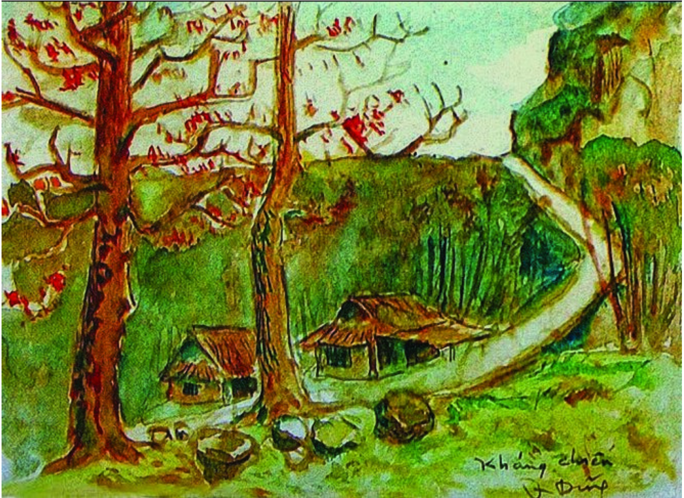
Tranh của Quang Dũng

TTO – “Đôi mắt người Sơn Tây/ U uẩn chiều luân lạc/ Buồn viễn xứ khôn khuây/ ...Đường hoa khô ráo lệ”.