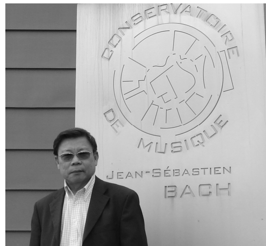
Ngày ra mắt Kim Vân Kiều ở Bussy Saint Georges