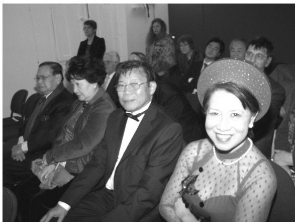
Ngày trình diễn tại Hàn Lâm Viện Âu Châu (28 tháng 11 năm 2009)