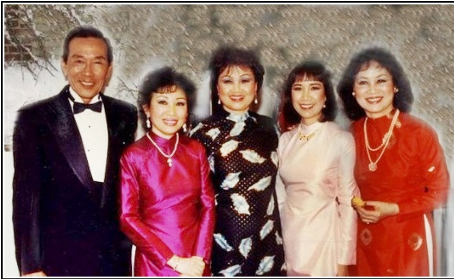
Anh Ngọc, Mai Hương, Kim Tước, Quỳnh Giao, Hà Thanh