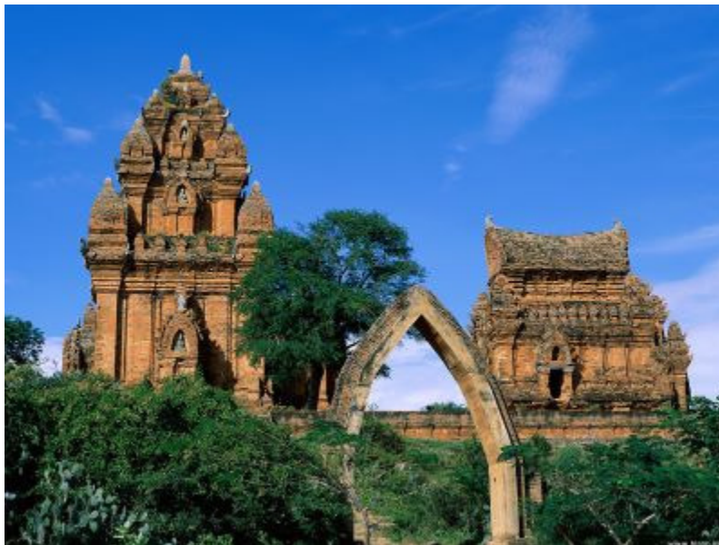
Tháp Chăm Ninh Thuận