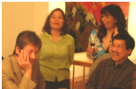
Từ Công Phụng, Diệu Liên, Tâm Hào, Phan Anh Dũng