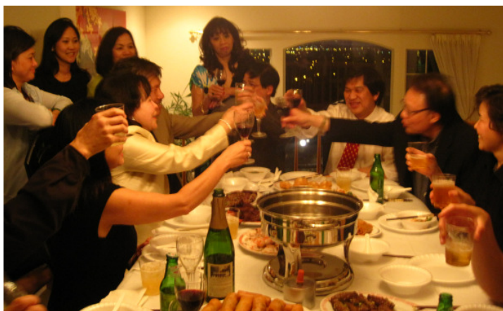
Ly rượu mừng - Santé!