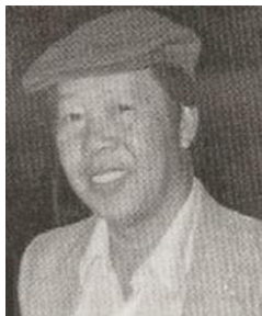
NGUYỄN SA (1932-1998)