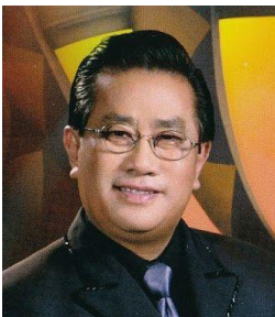
SONG NGỌC (1943-2018)

Mà người về nơi đâu nơi đâu? Tàu vẫn đi nên vẫn có người đợi chờ Sương lạnh nhẹ rơi trên vai Trăm con tàu trăm lối Tôi đưa người hay đưa tôi ?