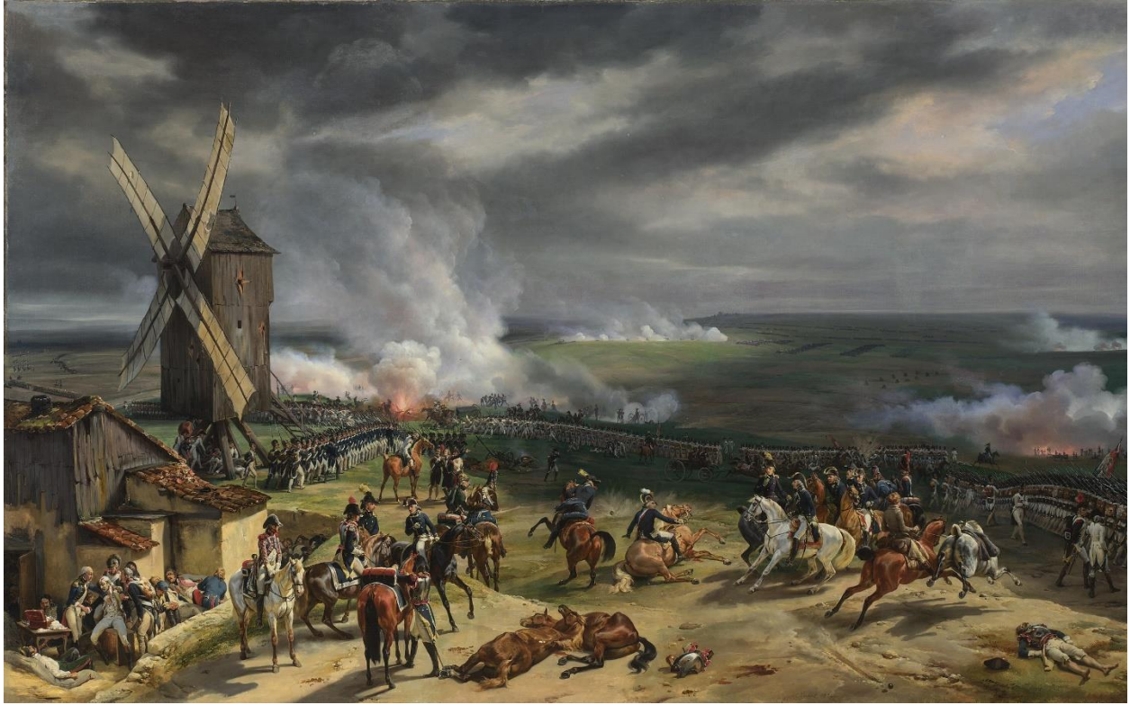
Trận chiến Valmy

Cuối năm 1792, Goethe đã lập công với Công Tước Carl August trong trận chiến Valmy chống lại quân đội cách mạng Pháp khi đoàn quân này xâm lăng nước Đức. Goethe cũng là nhà quan sát quân sự giúp Công Tước Carl August trong cuộc vây hãm thành Mainz, tất cả các công lao này đã được Goethe ghi lại trong tác phẩm Complete Works (Các Công Tác Hoàn Thành).