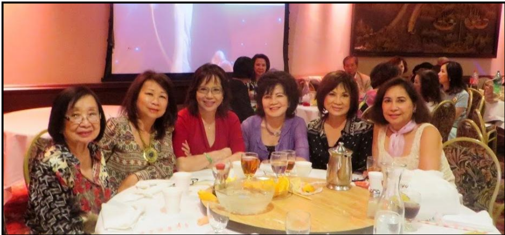
Gia Đình Trung Vương HTD