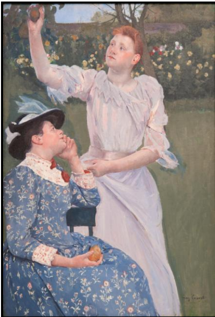
Young Woman Picking Fruit 1891

- Woman with a Pearl Necklace in a Loge , 1879, sơn dầu trên vải bố 81 x 60 cm, Philadelphia Museum of Art. Bức họa này vẽ Lydia Cassatt, chị của họa sĩ, đang ngồi trong loge trong đại hí viện Opéra ở Paris, ăn diện lịch sự, tóc uốn gọn, chuỗi vòng hạt trai trên cổ, tỏa ra vẻ quý phái, áo hở cổ màu hồng, tay cầm quạt, ghé ngồi màu đỏ, xa xa màu vàng của balcon, bức họa nắm bắt được khoảnh khắc hạnh phúc đặc biệt, hình ảnh một phụ nữ mới, một mình buổi tối ra ngoài thưởng thức kịch nghệ trong thành phố văn minh (en.Wikipedia.org - Woman with a Pearl Necklace in a Loge.)