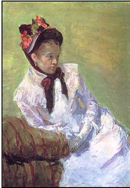
Mary Cassatt tự họa c. 1878, lúc đó khoảng 34 tuổi. Metropolitan Museum of Art, New York