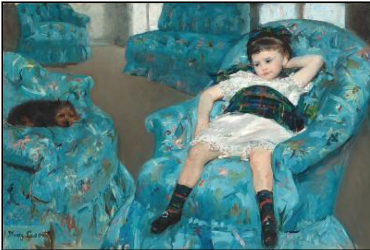
Little Girl in a Blue Armchair ( source : en.wikipedia.org - Mary Cassatt)

In the Garden, The Cup of Tea, Little girl in a blue armchair , The Loge, Lady in the Tea Table, Lydia Crocheting in the Garden, the Boating Party , The Child’s Bath, In the Omnibus, Woman Bathing v.v..