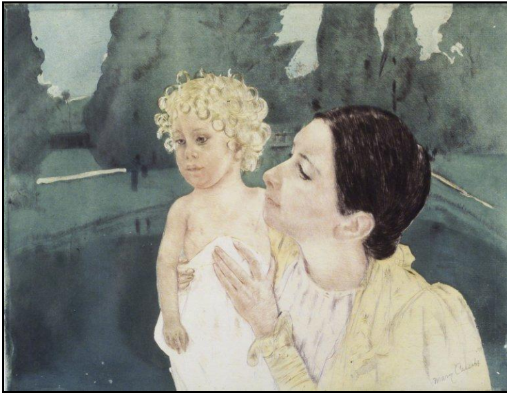
(Mother and Child Before the Pool Brooklyn Museum )