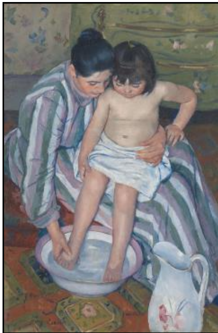
(The Child's Bath 1893 sơn dầu trên vải bố, khổ 39x26 in., trưng tại Art Institute of Chicago. Link : en.wikipedia under Mary Cassatt)