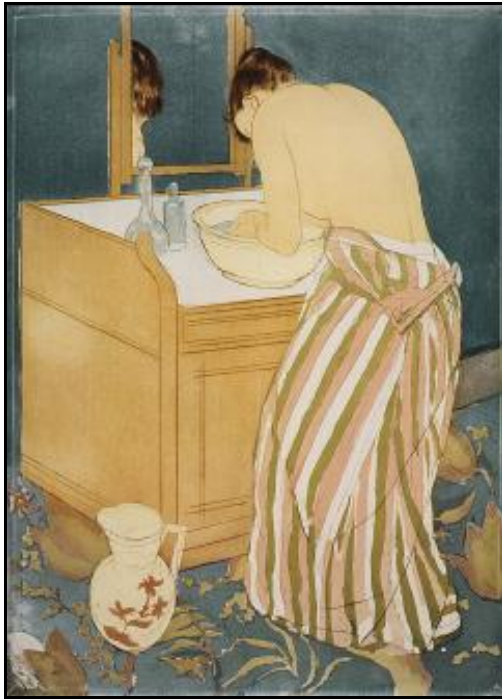
Woman Bathing (La Toilette) 1890-1891, Drypoint and aquatint print, Metropolitan Museum of Arts.

Chịu ảnh hưởng về kỹ thuật drypoint và theo lối ấn họa của hai danh họa Nhật Utamano và Toyokuni, Bà được gọi là “Ambassadrice de L’Impressionnisme aux États-Unis d’Amérique,” vì nhờ bà mà giới thướng ngoạn nghệ thuật tại Hoa Kỳ được biết đến họa phẩm Ấn Tượng của các họa sĩ Pháp. (Source: en.wikipedia.org under Mary Cassatt)