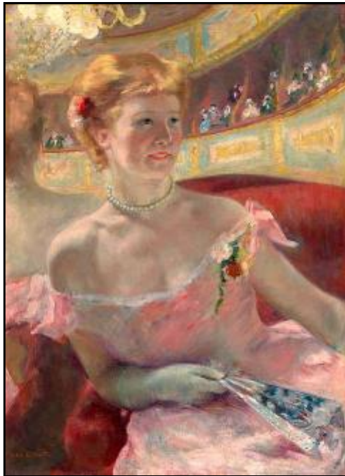
Woman with a Pearl Necklace in a Loge

Mary Cassatt trưng 11 bức, gồm cả bức Lydia ngồi ghế loge, đeo chuỗi hạt trai . (Woman with a Pearl Necklace in a Loge - en.wikipedia.org)