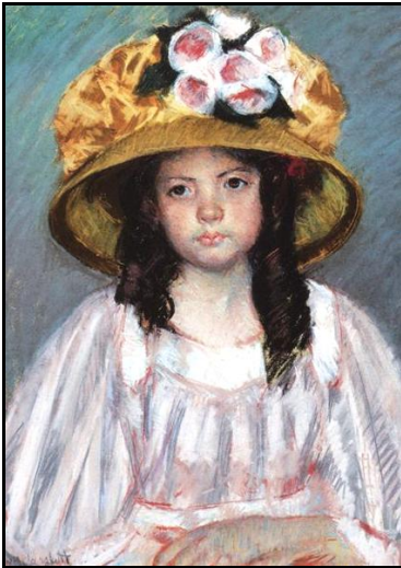
Young Girl in a Large Hat

Mary Cassatt là bạn thân nhưng không phải người yêu của Degas. Với kinh nghiệm đã từng học tại École des Beaux-Arts, hơn Mary Cassatt 10 tuổi, Degas chỉ dẫn cho Cassatt về Pastels và lối khắc họa engravings. Ngược lại về phần mình, Cassatt là chủ chốt trong việc giúp bán họa phẩm của Degas và đề bạt họa phẩm của ông và những họa phẩm của các họa sĩ Ấn tượng khác cho giới thượng ngạo danh họa tại Hoa Kỳ.