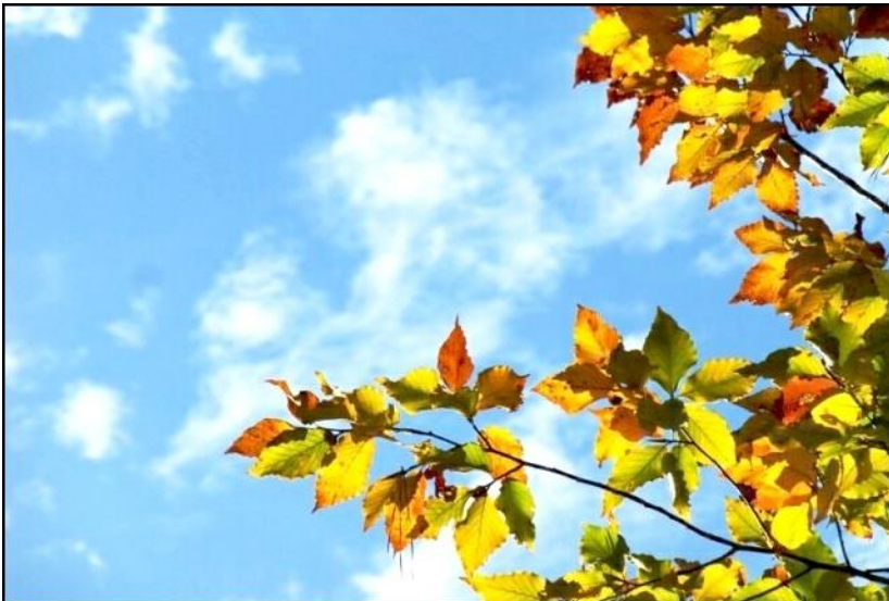
~ Sáng Thu (Richmond, Virginia) ~

” ... Biết ơn là một ngôn ngữ chung của nhân loại, là tiếng nói thiết tha và tràn đầy ân tình của tâm hồn. Trong cuộc sống bận rộn ở Hoa Kỳ, ai cũng phải tất bật, hối hả lao vào cái vòng quay rất nhanh và rất mạnh của đời sống vật chất, đến nỗi nhiều khi người ta quên đi đời sống tinh thần! Cho nên, nhân mùa Lễ Tạ Ơn Thanksgiving, ước mong rằng mỗi người trong chúng ta hãy dành một khoảng thời gian, ngồi một mình nhìn lại quãng đời đã qua, chúng ta đã cho đi và nhận lại những gì? Hãy nói với nhau những lời yêu thương dịu ngọt; hãy trao cho nhau những ánh mắt trìu mến nồng nàn; hãy dành cho nhau một chút thời gian để cảm nhận được cái sự may mắn nhất mà chúng ta có được trong cuộc sống ngày hôm nay, nhỏ bé thôi nhưng thật gần gũi, thật ấm áp và cũng như dành một vài phút hít thở không khí trong lành buổi sớm mai, ngắm ánh nắng vàng lấp lánh trên những ngọn cỏ còn ướt đẫm sương mai, hãy ngắm một nụ hoa vừa hé nở nơi góc vườn, hãy cùng nghe lại một khúc tình ca trong kỷ niệm ...” – BH