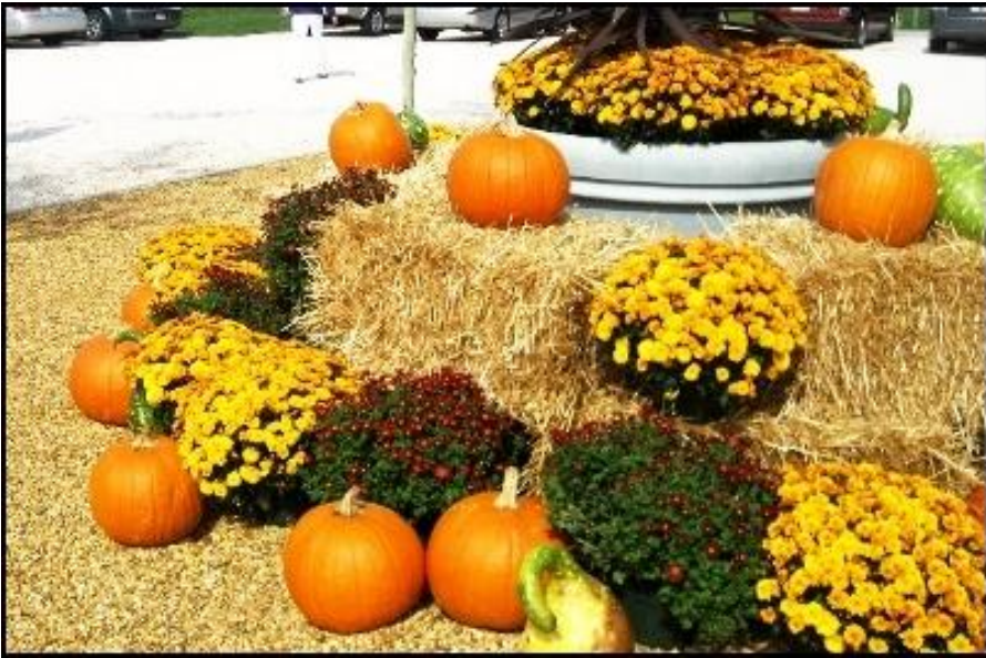
~ Thanksgiving ở DuPont Mansion, Wilmington Delaware ~

“... Xin tạ ơn đất mẹ Việt Nam đã sinh ra tôi, tạ ơn đất Mỹ đã cứu mang, đã cho tôi một cuộc sống ấm êm tuy trầm lặng, bình thường nhưng hạnh phúc. Xin tạ ơn bố mẹ đã mang nặng đẻ đau nuôi nấng, dạy dỗ con nên người. Xin tạ ơn các bạn bè, người thân ở xung quanh đã giúp đỡ, đã bên cạnh tôi trong những ngày gian lao, khó nhọc cũng như vui vẻ, sung sướng.