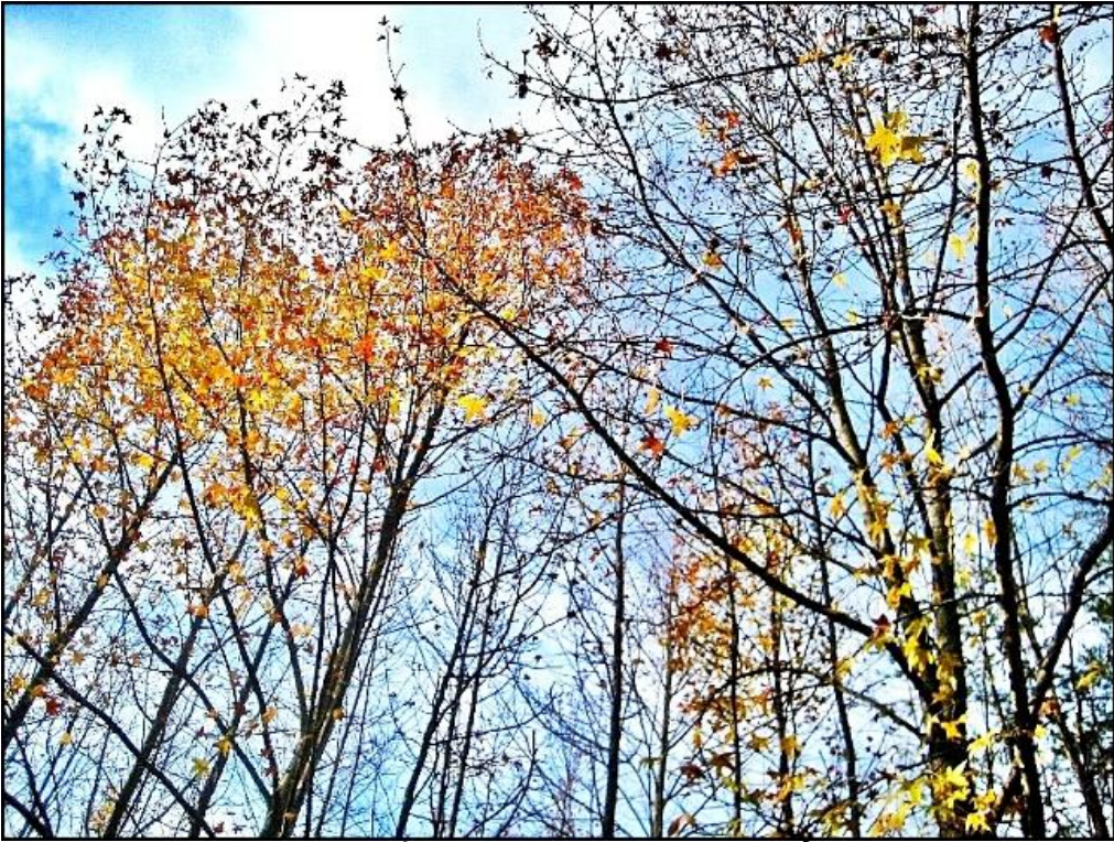
~ Góc Rừng Cuối Thu (Burke, Virginia) ~