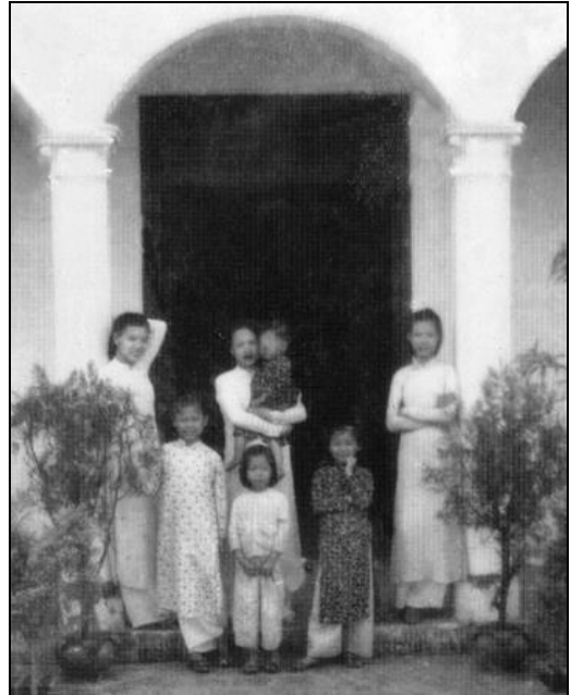
Nhà Mộc Thượng Đình thuở NTND 6 tuổi, đứng giữa dưới thềm.