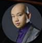
THIÊN TÔN Tenor