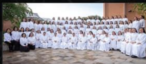
Chân Lý choir of Dominican Sisters with collaboration of priests and brothers

Tickets: $100 | $75 | $50 Purchase at: www.nnnd2.com