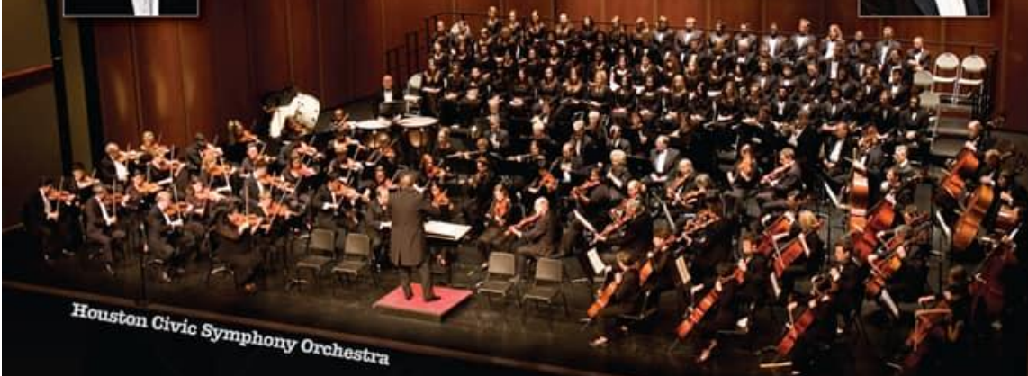
Houston Civic Symphony Orchestra