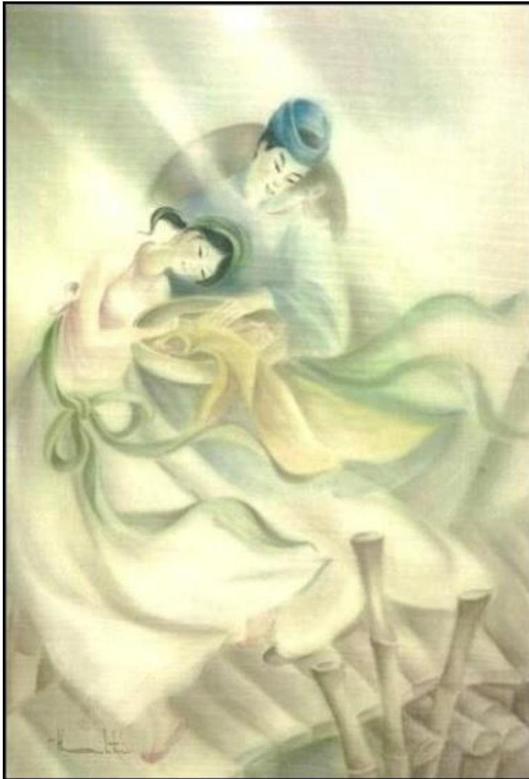
Yêu Nhau Cởi Áo Cho Nhau – Tranh: Thanh Trí Sacramento, California USA