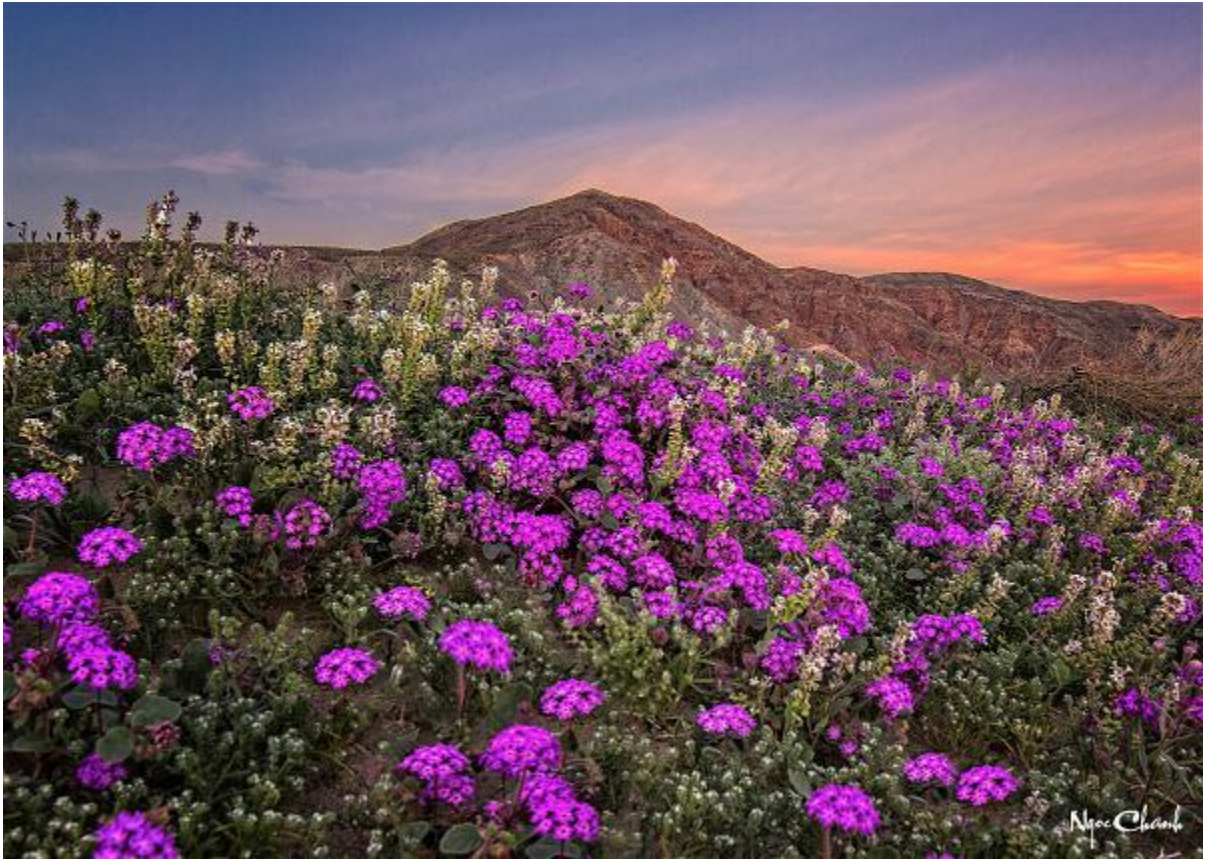
Pic 1 Anza Borrenco Wildflowers, California, Xuân