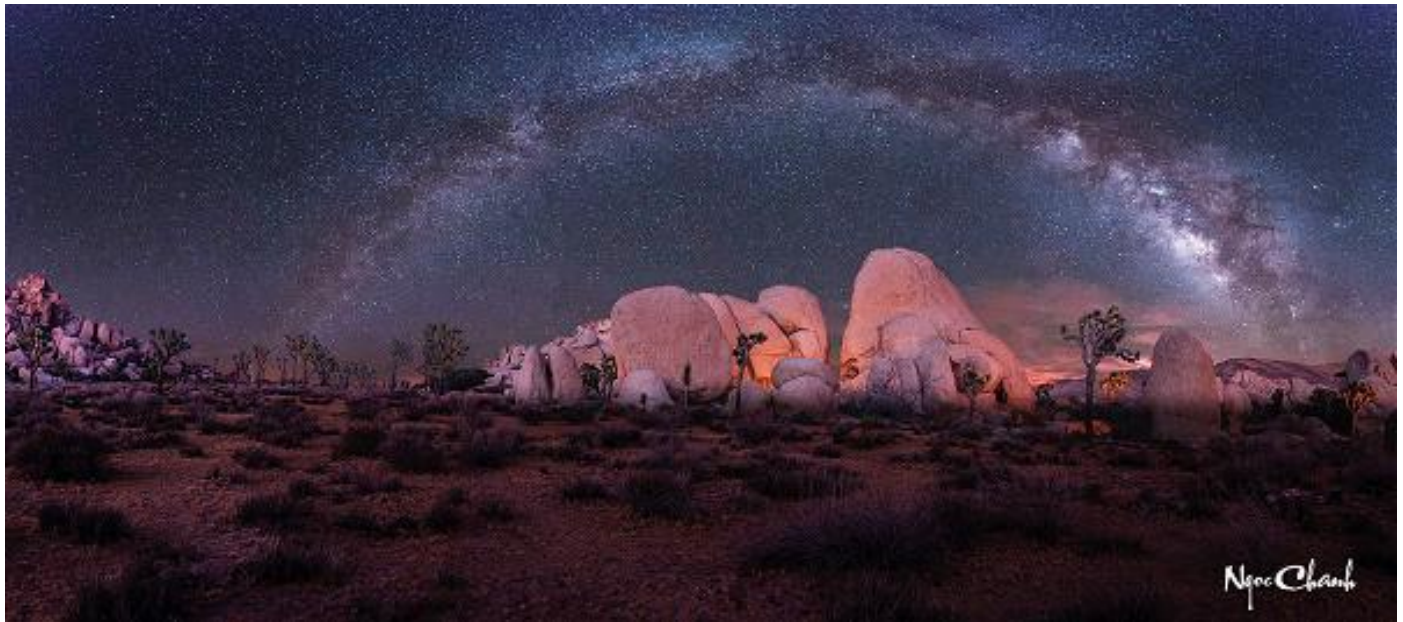
Pic 6 A night in Joshua Tree National Park, California

Hỏi: Là một NAG chuyên về phong cảnh, đề tài chú thích và thường chọn là gì? Nơi nào chú thường lui tới để chụp ảnh và mùa nào thích hợp trong năm?