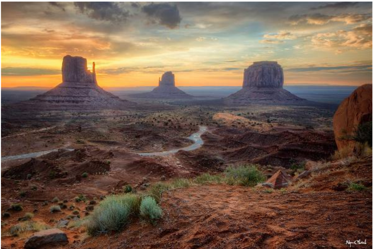
Pic 2 Monument Valley, Utah, Hạ