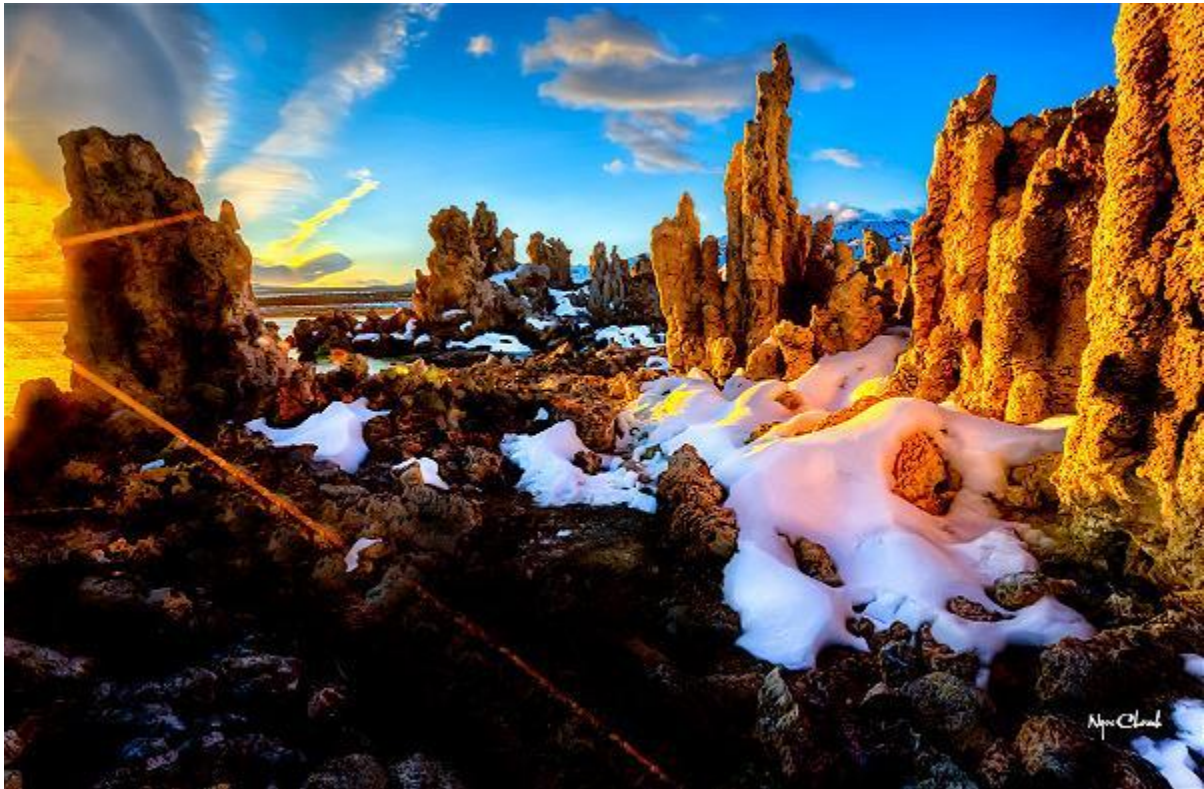
Pic 4 Mono Lake Sunrise, California, Đông