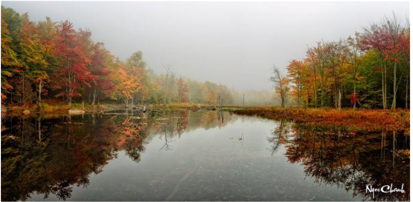
Pic 3 Canyon Brook Ponds, Maine, Thu