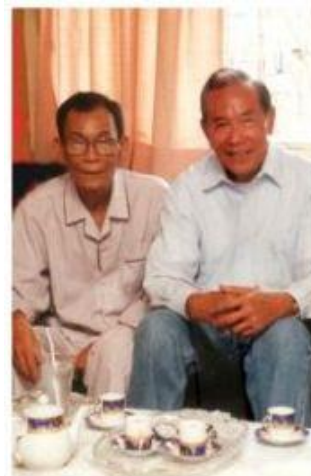
Nhà văn Văn Quang, Ca sĩ Anh Ngọc