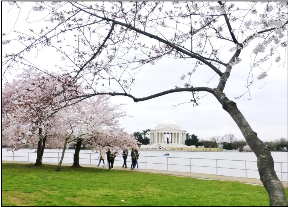
Hoa Anh Đào – Tidal Basin Hoa Thịnh Đốn – 25 tháng 3, 2022