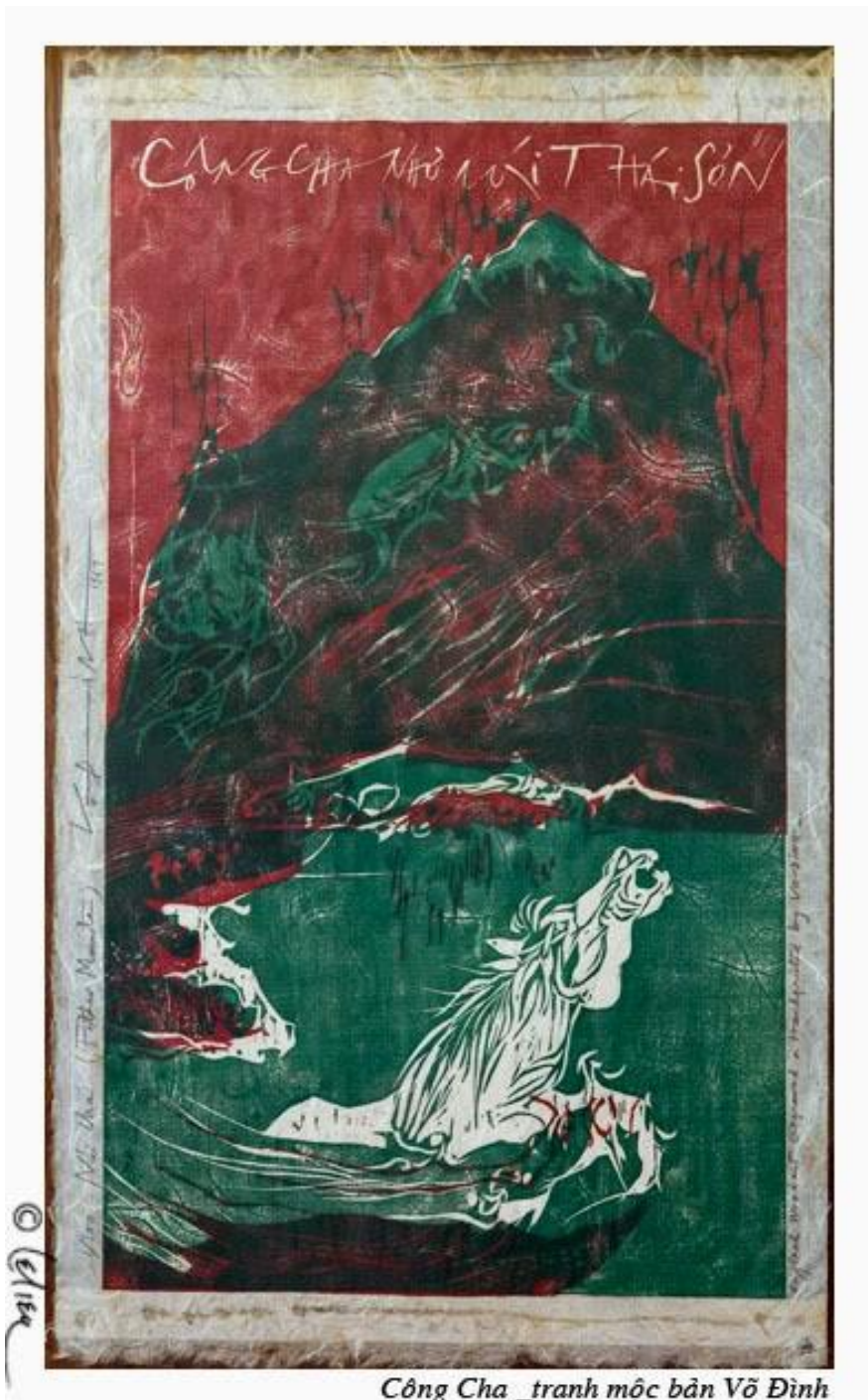
Công Cha _tranh mộc bản Võ Đình