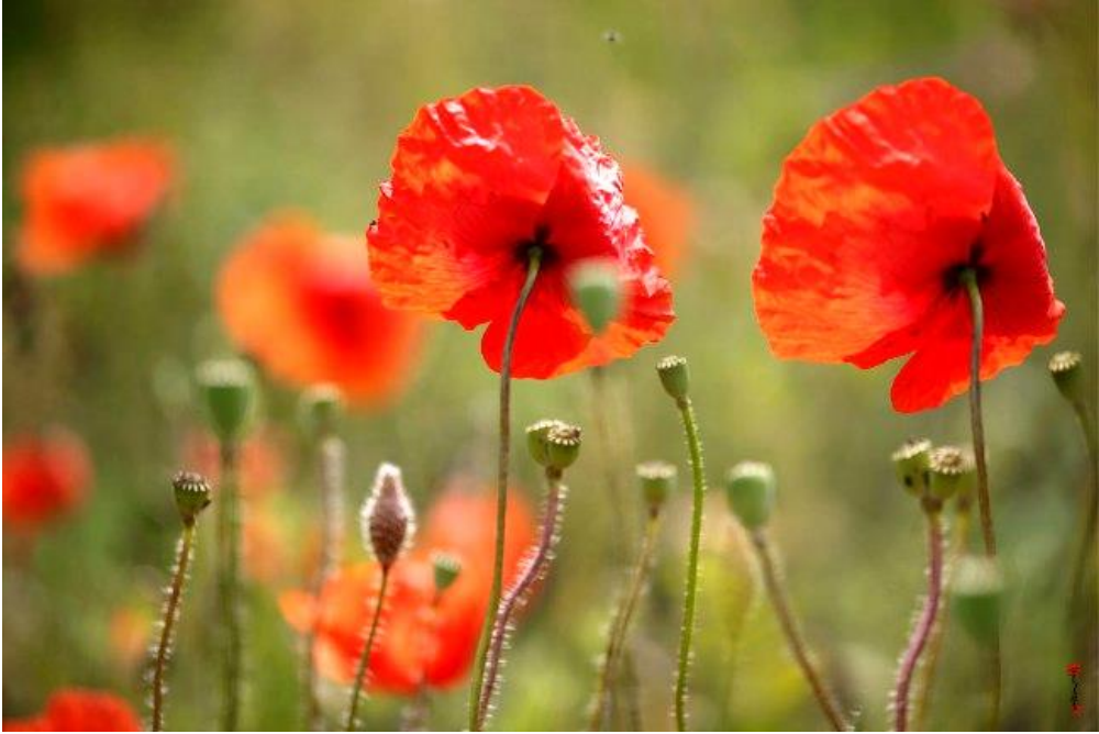
HOA ĐỒNG NỘI - Ảnh: NGUYỄN SƠN Germany