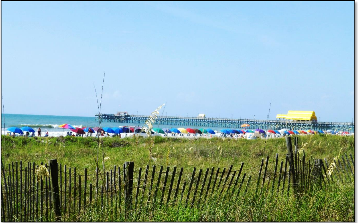
SUMMER 2016 – MYRTLE BEACH, S. CAROLINA USA - ANH: PAD