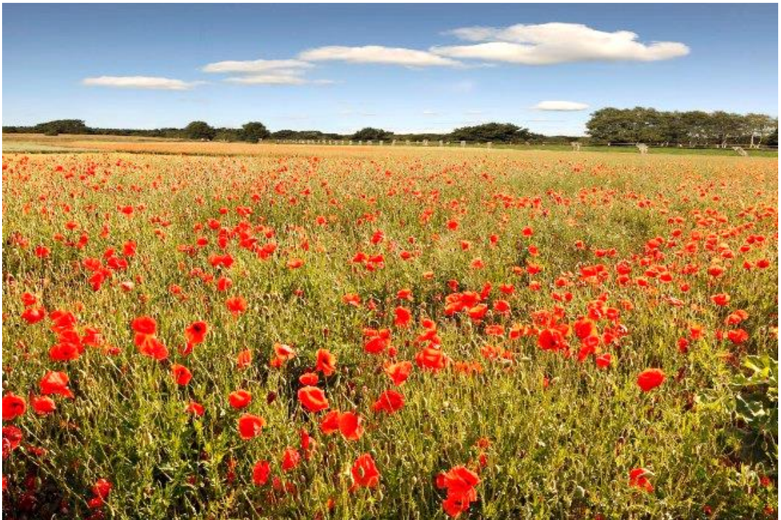
HOA ĐỒNG NỘI Germany