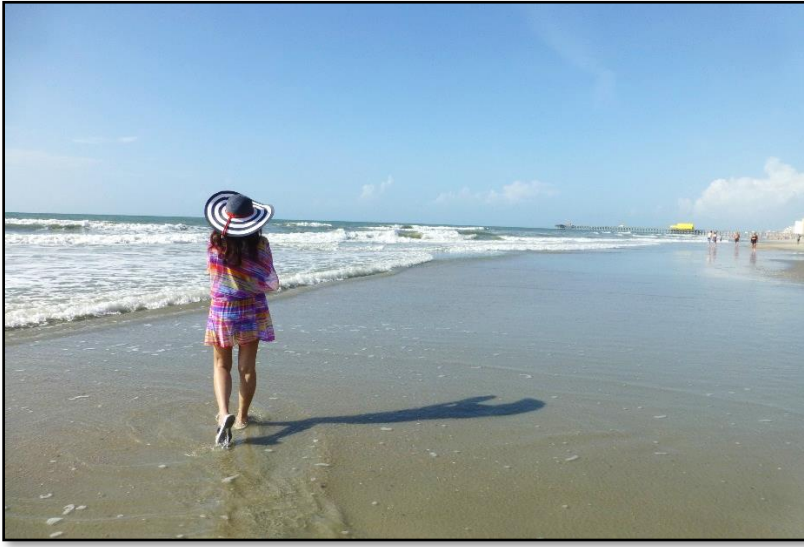
SUMMER 2016 – MYRTLE BEACH, S. CAROLINA USA