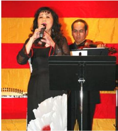
Cha Mãi Mãi Trong Con – Tâm Hảo ca

https://cothommagazine.com/images/stories/hoihoava/VuHoi/NgayVuHoiVirginia2009/ChaMaiMaiTrongCon-NT-VH-TH.mp3