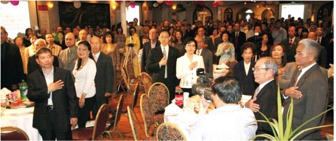
Chào Quốc Kỳ / một phút mặc niệm