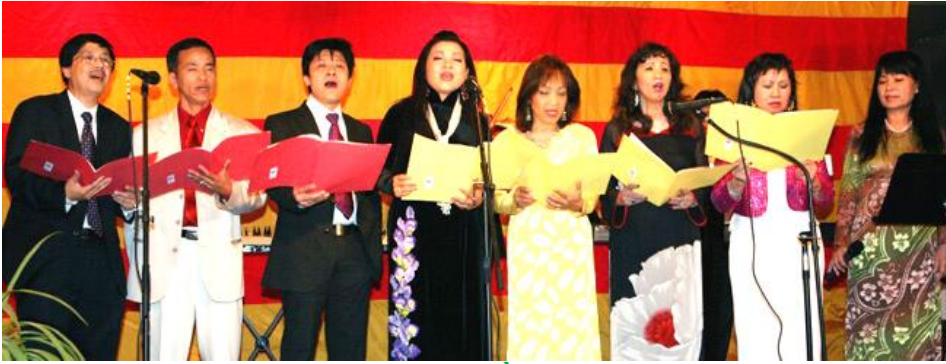
Sài Gòn Gân, Xa:

https://cothommagazine.com/images/stories/hoihoava/VuHoi/NgayVuHoiVirginia2009/SaiGonGanXa-HopCa.mp3