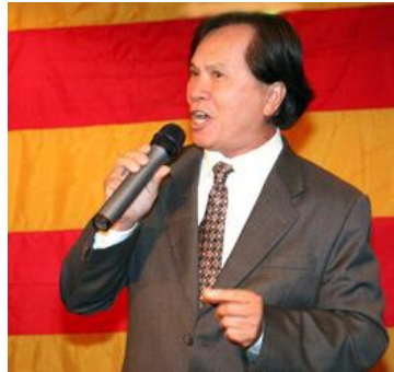
Lá Cờ Thiêng - Hoàng Tường ca

https://cothommagazine.com/images/stories/hoihoava/VuHoi/NgayVuHoiVirginia2009/LaCoThieng-HT.mp3