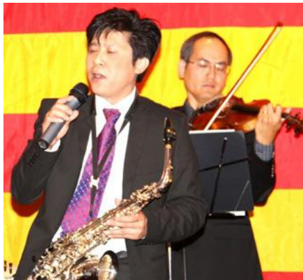
Còn Gặp Nhau - Hoàng Tiếp ca

https://cothommagazine.com/images/stories/hoihoava/VuHoi/NgayVuHoiVirginia2009/ChaMaiMaiTrongCon-NT-VH-TH.mp3